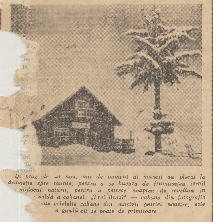
În pragul de un nou, mii de oameni ai muncii au plecat la drumetie spre munte, pentru a se bucura de frumusețea iernii în mijlocul naturii, pentru a petrece noaptea de revelion în caldă a cabanilor. „Trei Brazi” — cabana din fotografie ale celorlalte cabane din masivii patriei noastre, este o gazdă cât se poate de primitoare