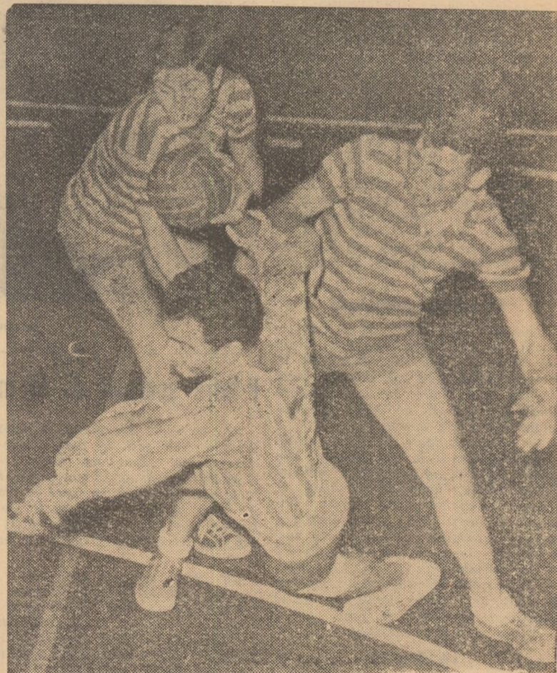
Fază din meciul I.T.B.—Constructorul