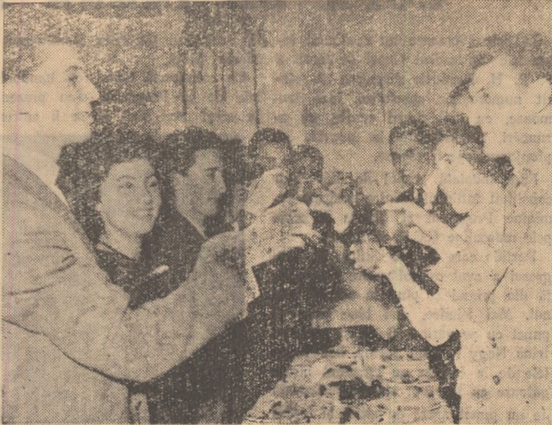
La mulți ani, tovarăși!

Conținînd tradiționalul pahar cu vin, oamenii muncii din Brașov privesc plini de încredere noul an, în care sînt create condiții pentru a se înregistra succese din ce în ce mai frumoase.