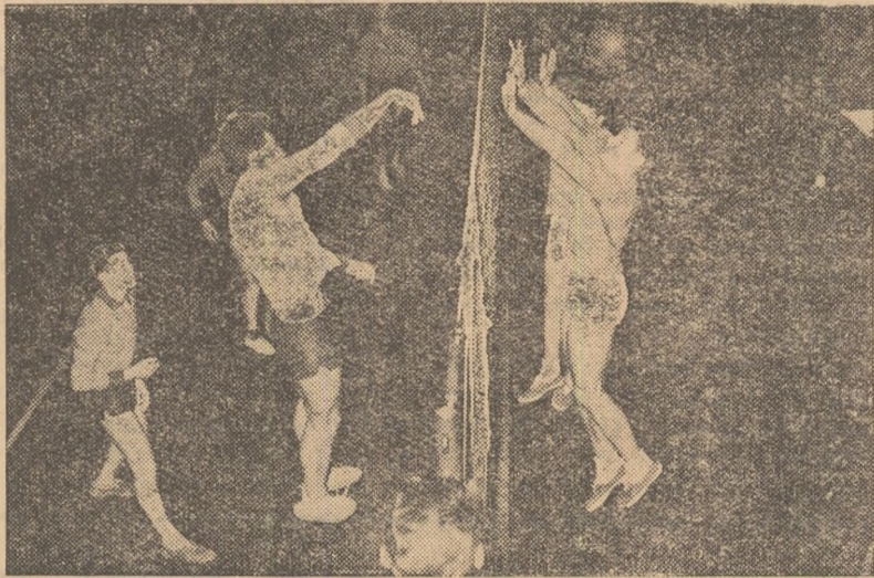
Aspect dintr-un meci al campionatului masculin 1959—1960: C.C.A.—Știința Timișoara (2—3)

Trofeele și tricourile de campioni ai Republicii Populare Romine la volei masculin au revenit deci voleibaliștilor din trei echipe bucureștene. Oare superioritatea voleiului masculin bucureștean este atât de mare față de cel din provincie? Nu! În fiecare an echipele din țară au asaltat cu hotărîre locurile fruntașe și au scos la iveală nenumărate ta-