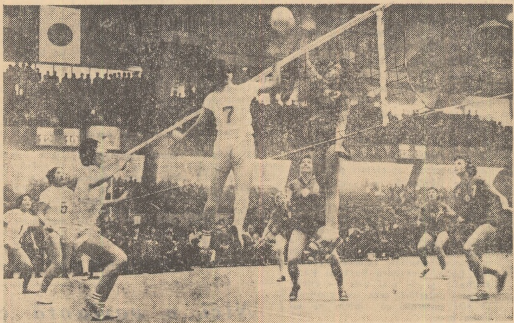
Recent, selecționatele de volei ale orașului Moscova au reieprins un turneu în Japonia. Jocurile voleibaliștilor sovietici au stîrnit un mare interes. În fotografie, o fază a întîlnirii dintre echipele feminine.

Învingînd cu scorul de 10—9 echipa Portugaliei, reprezentativa masculină de handbal în 7 a Franței s-a calificat pentru turneul final al campionatului mondial programat între 26 februarie — 12 martie în R.F. Germană. Alături de echipele Suediei, Germaniei (echipă unită), Japoniei, Braziliei, Islandei (calificate din oficiu), pînă în prezent la turneul final și-au mai cîștigat dreptul de a participa echipele Franței, Danemarcei și Iugoslaviei. Pentru celelalte 4 locuri candidază echipele U.R.S.S., R.P. Romîne, R.S. Cehoslovace, R.P. Polone, Elveției, Belgiei și Olandei. (Agerpres).