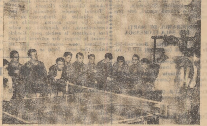
După antrenamentul de duminică jucătorii de la Progresul (în o scurtă ședință de lucru).

De fapt, este vorba de o continuare a antrenamentelor, pentru că noi nu ne-am întrerupt activitatea după campionatul de toamnă. Jucătorii s-au pregătit mereu punând accent pe îmbunătățirea tehnicii individuale. În plus, am susținut mai multe meciuri amicale dintre care câteva cu scop de popularizare. Am jucat, de pildă, în comuna Podul Turcului,