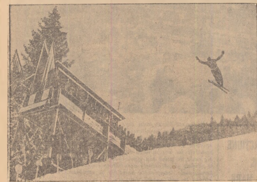
Aspect din desfăşurarea probei de sărituri din cadrul competiţiei dotate cu „Cupa Olimpia”

Zăpada, atât de mult aşteptată de sportivi a sosit — în sfârşit! Fireşte, este un bun prilej pentru o bogată activitate în sporturile de iarnă.