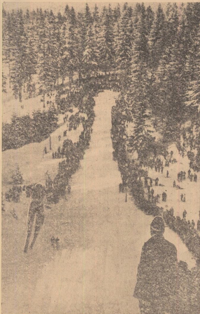
O imensă potcoavă formată din mii de spectatori. Acesta este aspectul întrecerilor de sărituri desfășurate duminică la Poiana Brașov în cadrul „Cupei Poiana Brașov“