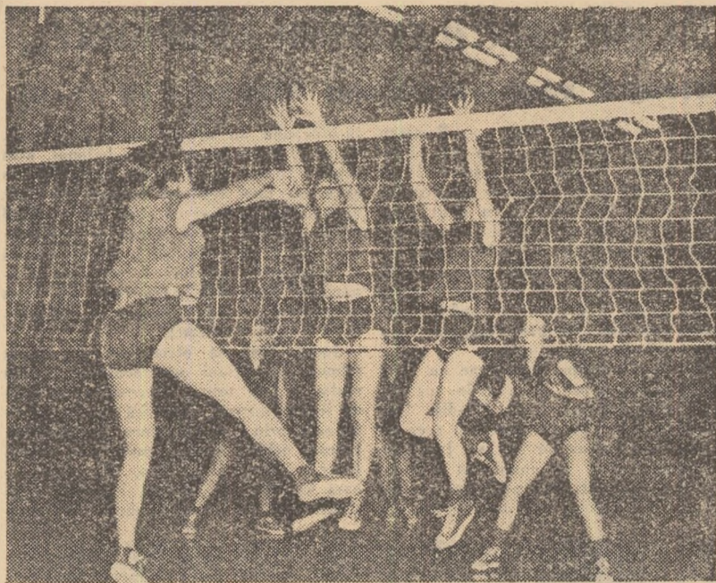
Fază din meciul Metalul București — C.S.M. Sibiu (3-2) disputat în prima parte a campionatului feminin

Voleibalistele noastre au de altfel resurse să facă acest pas. Au dovedit-o și în prima parte a campionatului cînd au existat și meciuri frumoase. Ne amintim și acum cu plăcere de jocul dintre voleibalistele de la Rapid și Metalul. Pentru a vedea cît mai multe meciuri spectaculoase, de bun nivel tehnic, antrenorii celor 12 echipe din campionatul nostru feminin și elevele lor au datoria să muncească mult și cu sîrguință. Este îndemnul pe care îl facem acum, în pragul returului.