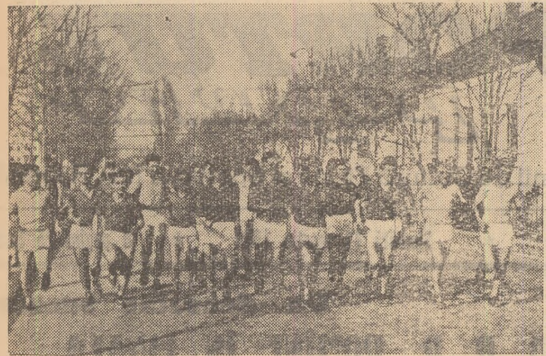
Primăvara, mai grăbită ca în alți ani, a sosit, făcând pe mulți sportivi să înceapă sezonul în aer liber înainte de deschiderea oficială. Pe aleile din curtea uzinei „Semănătoarea”, din Capitală tinerii muncitori fac un prim antrenament în vederea tradiționalelor crosuri de masă ce îi așteaptă