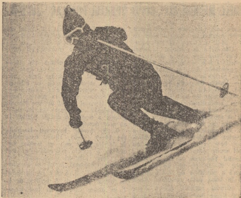
Ion Zangor (Casa Ofițerilor Brașov) a avut în actualul sezon o comportare constantă bună. În fotografie, o imagine din cursa de coborire din cadrul Concursului Internațional Jubiliar, unde s-a clasat pe locul 5

Cum se poate ajunge la însușirea acestui element esențial? Prin cit mai multe coboriri, prin „kilometri” parcursi zilnic la antrenamente, în condiții de concurs. Bineînțeles, pre-