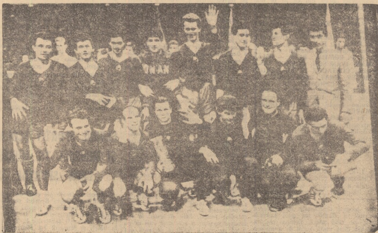
Echipa R.P. Romîne fotografiată la câteva clipe după primirea cupei de campioană a lumii.