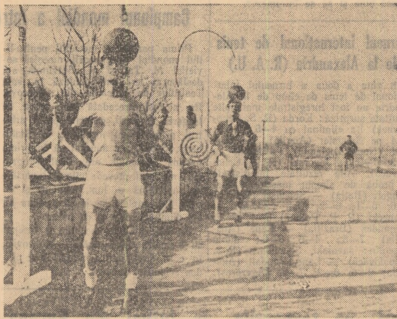
Una din echipele care au folosit în mod regulat aparatele ajutoare în cursul perioadei pregătitoare a fost Farul din Constanța. Aceasta fotografie înfățișează un aspect din pregătirea fotbalistilor constănțeni la un astfel de aparat: exerciții la „mingea suspendată” pentru îmbunătățirea jocului cu capul.

Pregătiri pentru retur nu s-au făcut numai în cadrul echipelelor de categorie A, ci și la... terenurile pe care se vor disputa jocurile acestui sezon atât de mult așteptat. La Stadionul „23 August”