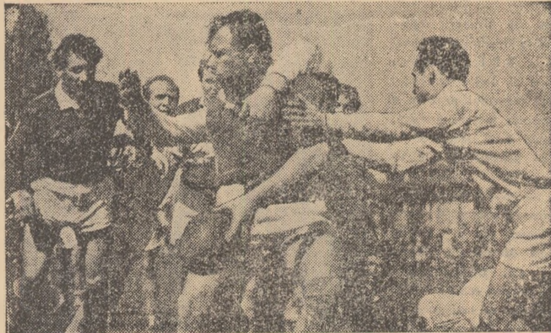
Dispută dîră între înaintări, aceasta a caracterizat partida dintre C.F.R. Grivița Roșie și Progresul (0—0)

ȘTIINȚA CLUJ, cu o formație mai bună ca anul trecut, pare că nu și-a