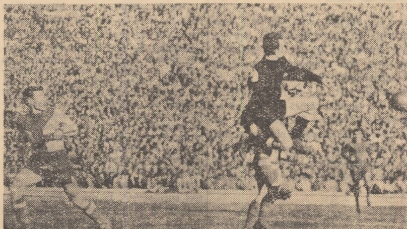
O fază din meciul C.C.A. — Farul Constanța (2—2): portarul Ghibănescu respinge balonul

Împreună cu zecile de mii de spectatori am dori ca în etapele viitoare, care programează o serie de meciuri echilibrate, să asistăm la cât mai multe jocuri de calitate, lipsite de durități, în care toți fotbaliștii să dea un randament în raport cu condițiile optime de pregătire și cu posibilitățile pe care le au.