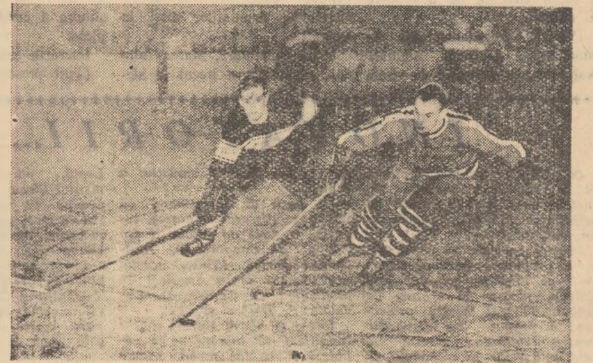
Luptă pentru puc, în plină viteză. Asemenea faze vom vedea desigur în număr mare în întrecerile care încep azi