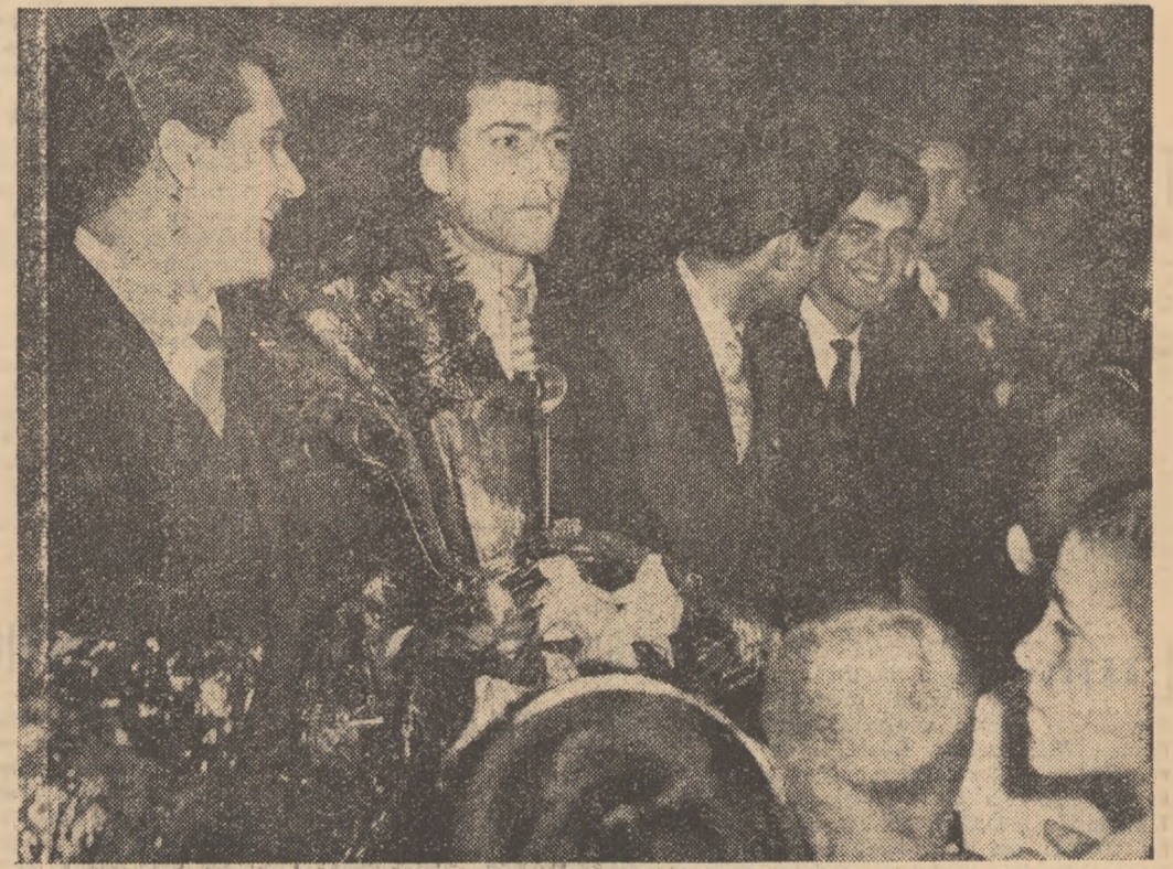
masculină de handbal în 7 a R. P. Române, campioană mondială.