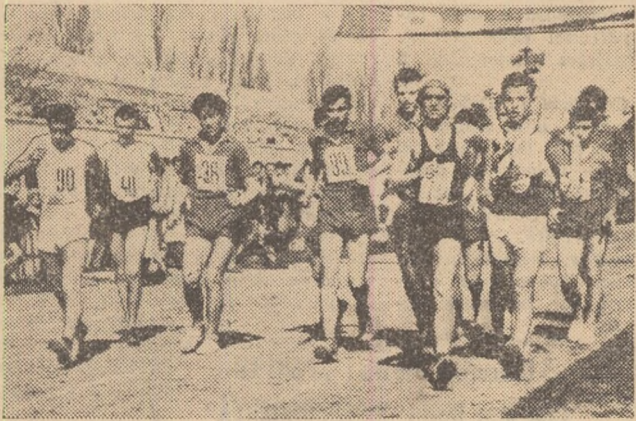
De pe stadionul Tineretului s-a dat plecarea în proba juniorilor din cadrul campionatului de marș pe echipe al Capitalei