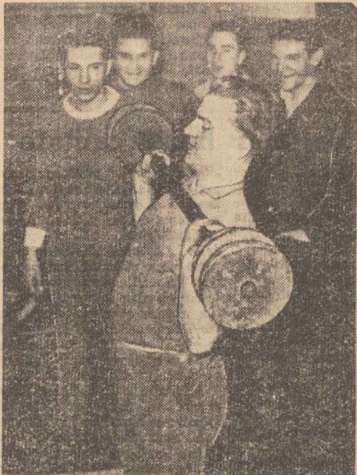
Halterele s-au bucurat de un real succes în actuala ediție a Spartachiadei. În fotografia de mai sus un aspect în care tinerii de la întreprinderea "Electronica" din Capitală se întrec în prima etapă