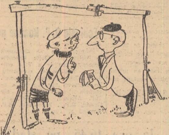
— Care a fost cel mai dramatic moment al meciului? — Șutul în bard din repriza a doua! Mi-era că-mi cade poarta-n cap! Desen de N. CLAUDIU

Bazele sportive din Călimănești sînt neîngrijite, iar porțile terenului de fotbal din Căciulata aparținînd asociației sportive Oltul, sînt gata să cadă (Nicolae D. Nicolae-corespondent)