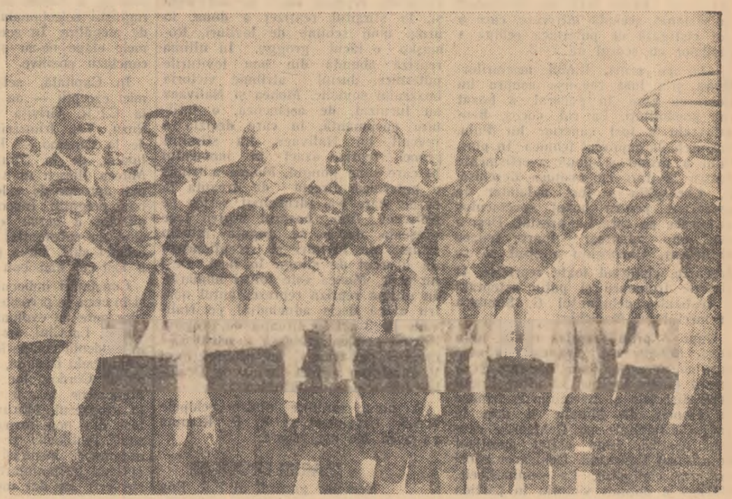
Pe aeroportul Otopeni, la sosirea inaltilor oaspeți cehoslovaci.

Miercuri la amiază a sosit în Capitală delegația de partid și guvernamentală a R. S. Cehoslovace care face o vizită de prietenie în țara noastră la invitația Comitetului Central al Partidului Muncitoresc Român, Consiliului de Stat și guvernului R. P. Romine.