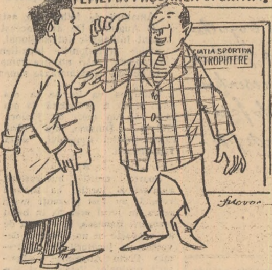
— Pentru atragerea femeilor în sport am făcut ținea asta — Doar atît? — Cum? Nu-i de ajuns? Atunci mai facem... o țincă. Desen de S. NOVAC