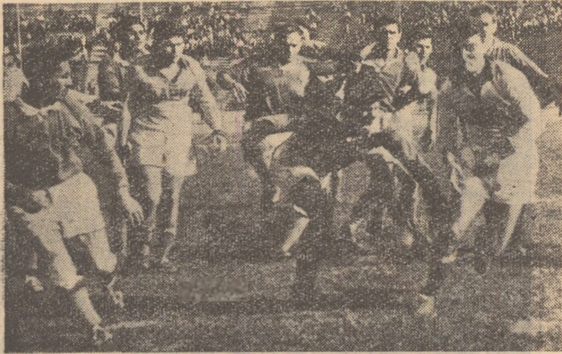
Cit de viu disputată a fost întâlnirea dintre C.C.A. și Rapid ne-o dovedește și imaginea de față

C.C.A. — Rapid 18-9 (8-0). Mult mai dificilă decât era de scontat victoria rugbiștilor militari asupra noii promovate, Rapid. Întâlnirea a fost interesantă ca aspect și de o bună valoare tehnică. Practicnd un joc curajos, rapidiștii au luptat de la egal cu fruntașii clasamentului, aflându-se chiar în situația de a egala