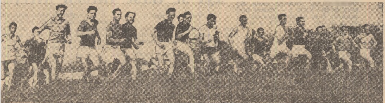
După 150 de metri de la plecarea concurenților în crosul „Să intimpinăm 1 Mai” ei au o porțiune dificilă de parcurs. Aspec- tu în lăzua finală a raionului V. I. Lenin din Capitală

Iată și programul celor trei zile de întreceri: VINERI: Rapid — Minerul Vulcan și Progresul — Mureșul; SIM- BĂȚI: F. Cazacu, A. Bran, V. Dumitrescu, M. Jipa, A. Va- silo) și o serie de tinere hand- baliste promovate din echipe Progresul.