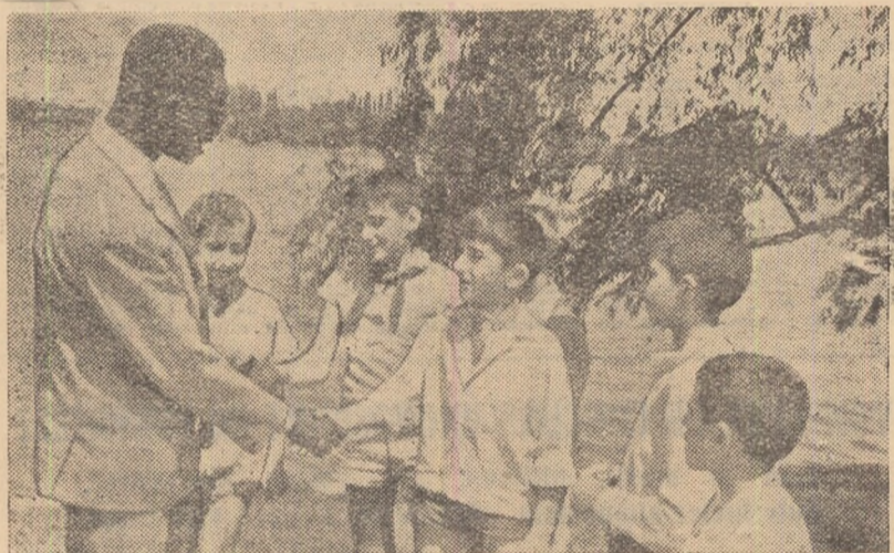
S-a născut o nouă prietenie... Vizitând Bucureștiul, cu prilejul ultimei ediții a campionatelor internaționale de atletism, sportivul african Abdou Seye a cunoscut, în decorul minunat al lacului Herăstrău, acest grup voios de pionieri.

S PORT, PRIETENIE, PACE! De nedespărțit au devenit aceste trei cuvinte. În numele lor se înalță drapelul alb olimpic, cu cele cinci cercuri ale sale, simbol al înfrățirii continentelor, lor le sint închinată uriașe competiții ale tineretului din lumea întreagă. Și nici n-ar putea să fie altfel! Prin sport oamenii ajung să se cunoască mai bine, să se aprecieze, să se iubească. Nenumăratele prietenii, care au rămas la fel de trăinice și după ce foștii campioni au părăsit scena marilor întreceri, stau mărturie.