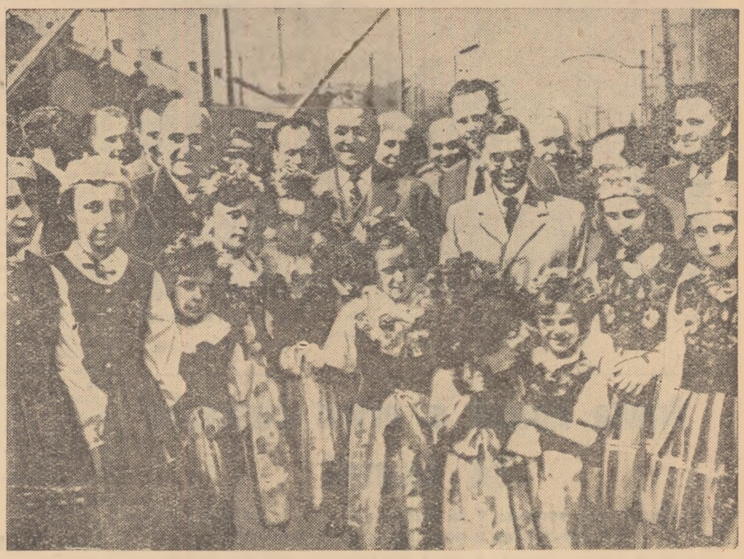
În Silezia delegația de partid și guvernamentală a țării noastre în frunte cu tovarășul Gheorghe Gheorghiu-Dej este întâmpinată cu entuziasm și bucurie

Ieri, în ultima zi a vizitei în R.P. Polonă a delegației de partid și guvernamentale a R.P. Române, condusă de tovarășul Gheorghe Gheorghiu-Dej, s-a desfășurat în Sala Congreselor din Palatul Culturii și Științei un în-