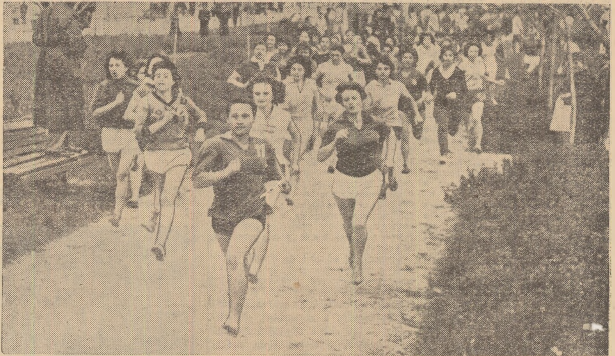
Intrecerile de cros din cadrul fazei orășenești au fost — după cum se vede și din fotografia noastră — desebit de disputate Foto: I. Mihăică

Fotoreportaj de GALIN ANTONESCU (text) și BORIS GIOBANU (fotografii).