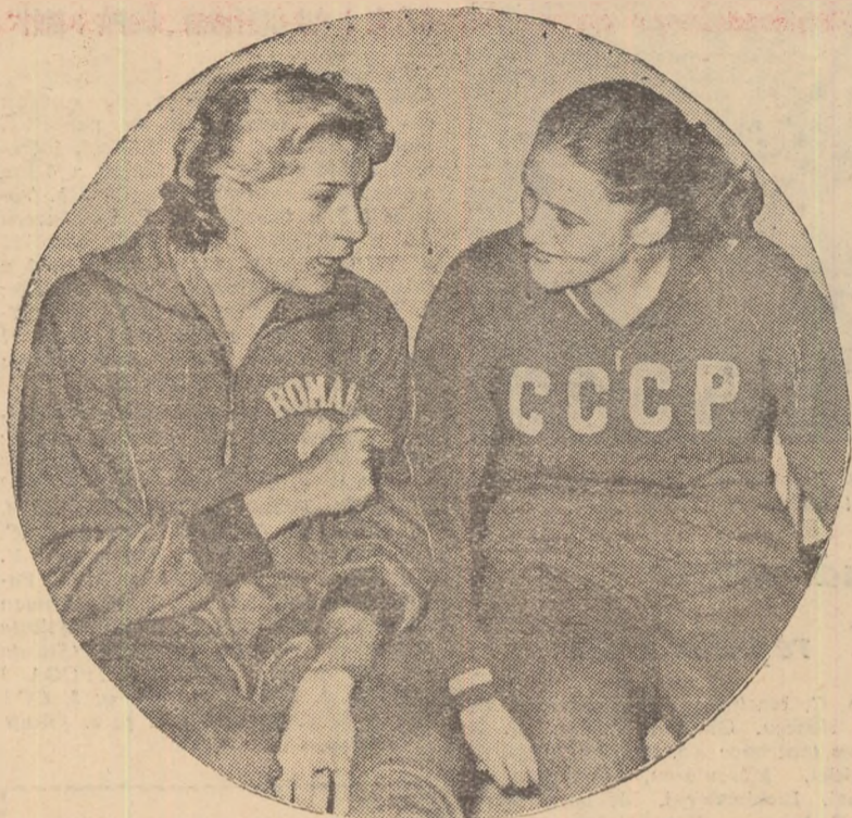
Cite nu au să-și povestească două mari campioane, două vechi prietene! În toamna anului trecut și în primăvara aceasta, maestrele emerite ale sportului Iolanda Balaș și Tamara Press au făcut un schimb de vizite: Tamara a venit la București, iar Ioli a fost la Leningrad. Și nu s-ar putea spune că cele două revederi n-au fost rodnice: noul record mondial al Iolande și performanțele din sală obținute de Tamara atestă acest lucru. Prietenia sportivă aduce și recorduri...