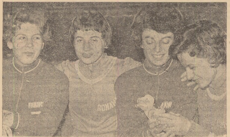
Un cadou, cât de mic, produce bucurie nu numai... copiilor. Fotografia de mai sus, luată cu ocazia întâlnirii dintre gimnastele noastre și cele franceze, ne-o dovedește.