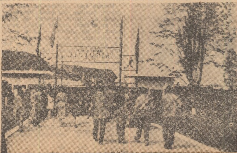
Jos: iubitorii sportului din localitate se îndreaptă grăbiți pentru a-și ocupa locurile în tribunele stadionului.