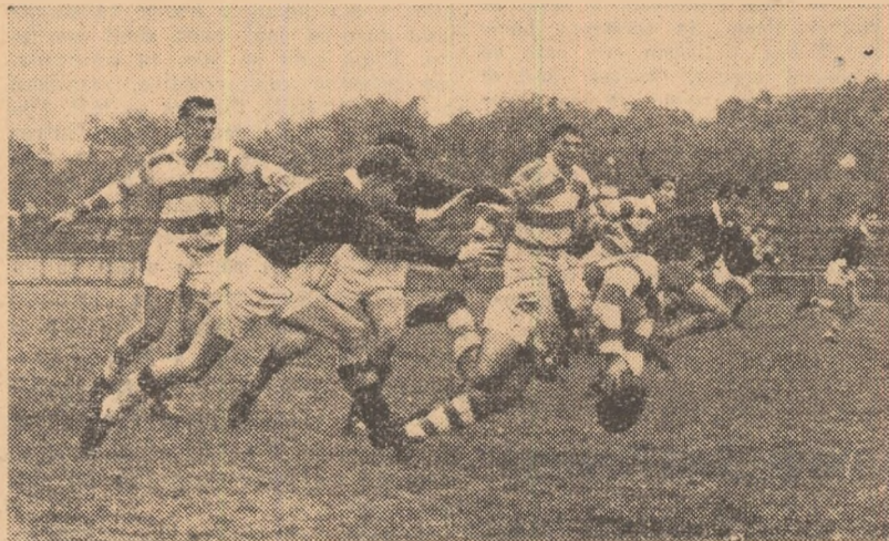
O fază spectaculoasă din întîlnirea Dinamo București — Știința Petroșani (3-0)