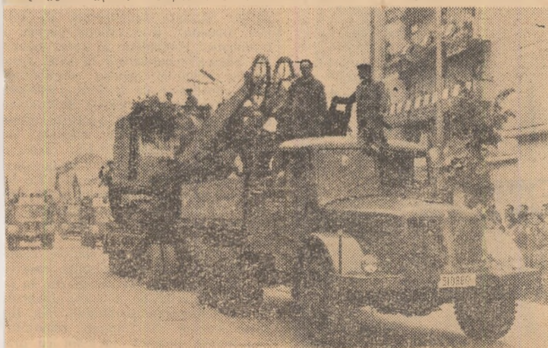
La Galați, în cadrul entuziastei manifestații a oamenilor muncii închinată zilei de 1 Mai, demonstrează constructorii viitorului combinat metalurgic.