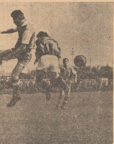
Fază din meciul Metalul București — Chimia Govora 3-1. Atac la poarta echipei oaspe

JOC ADAPTAT LA STAREA TERENULUI. Terenul desfîndat a cerut eforturi mari jucătorilor echipelor