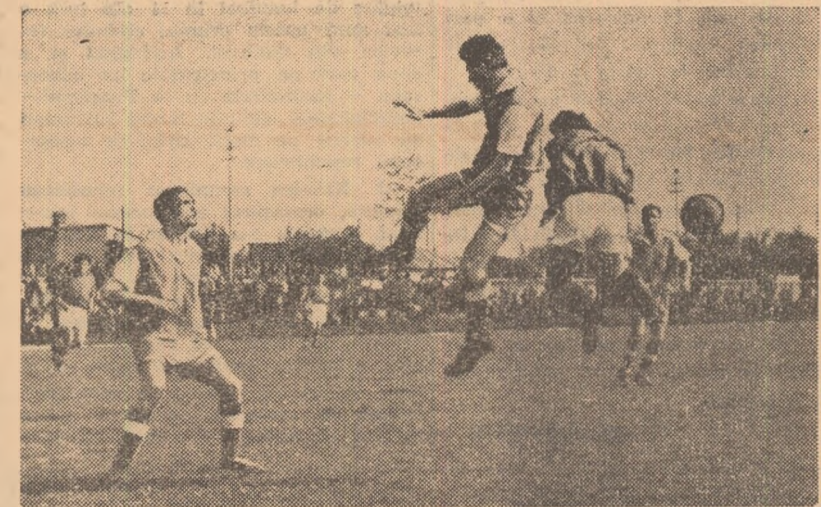
Fază din meciul Metalul București — Chimia Govora 3-1. Atac la poarta echipei oaspe

tul Birlad (3-1), dinamoviștii puteau învinge la o diferență mai mare, dar pe de o parte înaintașii lor au ratat copilărește ocazii clare, iar pe de altă parte portarul oaspeților, Leală, a apărut foarte bine. Meci disputat în limitele sportivității. Timp ploios, teren desfîndat. Au marcat: Ni-