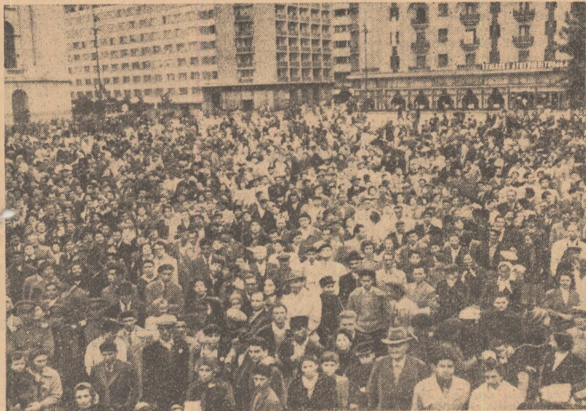
Un public numeros a asistat în ziua de 1 Mai la manifestațiile culturale ce au avut loc pe estrada instalată în Piața Republicii din Capitală

Sighișoara, Gloria Dumoraveni și alte asociații care și cu prilejul primei ediții a Concursului cultural-sportiv au obținut succese deosebite. Apoi, pe gazonul verde s-au întrecut atleții, handbaliștii, fotbaliștii etc. Entuziasmul cu care sportivii sighișoreni au pornit la disputarea probelor Concursului cultural-sportiv al tineretului a demonstrat popularitatea acestei mari competiții de mase precum și faptul că organizațiile U.T.M. și consiliile asociațiilor sportive din raionul și orașul Sighișoara au popularizat din timp condițiile de participare la acest concurs. ION TURJAN — coresp.