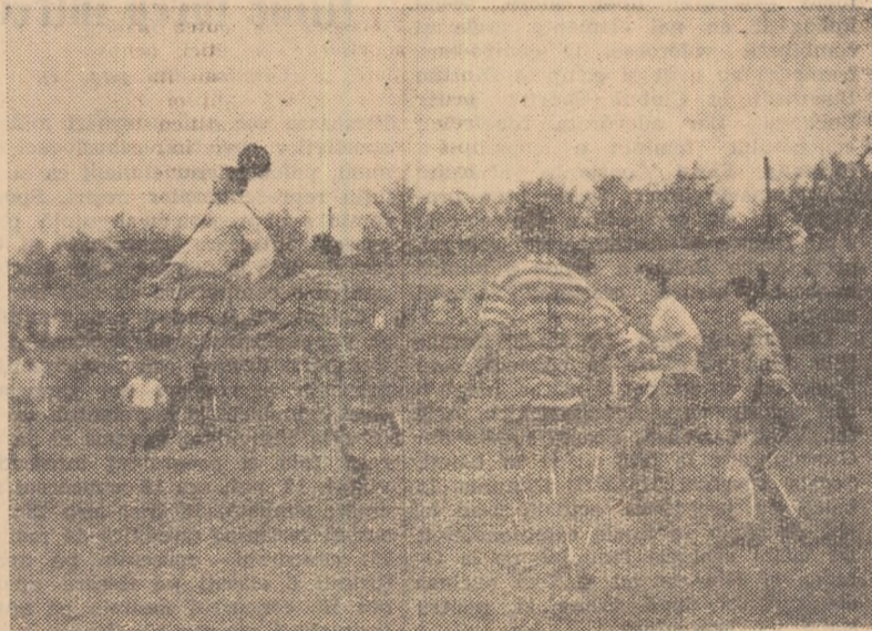
Aspect de la antrenamentul de ieri al lotului A. Constantin (în tricou alb) rețea balonul cu capul