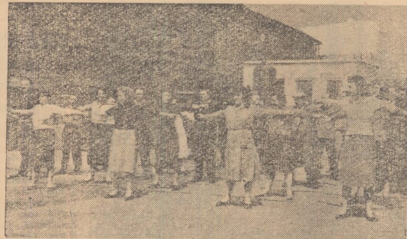
Un, doi, trei! Un, doi, trei! Comenzile date de către instructorul voluntar cu gimnastica în producție sînt executate cu multă plăcere de către salariații întreprinderii „Armătura” din Capitală. Ei se întorc la locul de muncă bine dispuși, voioși.