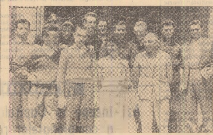
În vizită prin Capitală, scrimerii din R.P. Polonă și R.D. Germană, au făcut un scurt popas și la clubul sportiv Dinamo.