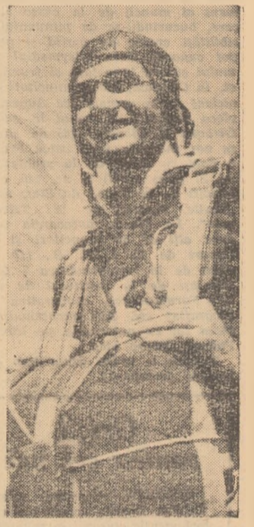
Gheorghe Iancu, dublu recordman al lumii la parașutism.