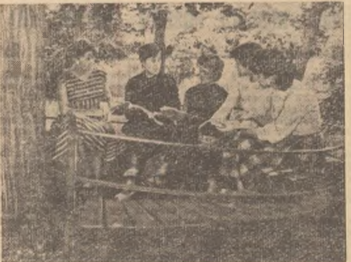
Studentele I.C.F. din grupa 101 învață cu înfrigurare.