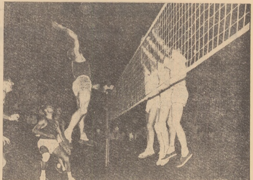
Simbătă și duminică s-a desfășurat ultima etapă a campionatului republican masculin de volei. Titlul a revenit din nou echipei Rapid. Iată o fază din meciul Rapid-Progressul. Plocon, urmărit cu atenție de coechipieri, pune mingea peste blocul „în 3” executat de jucătorii Progressului. (Citiți amănunte în pagina a doua).