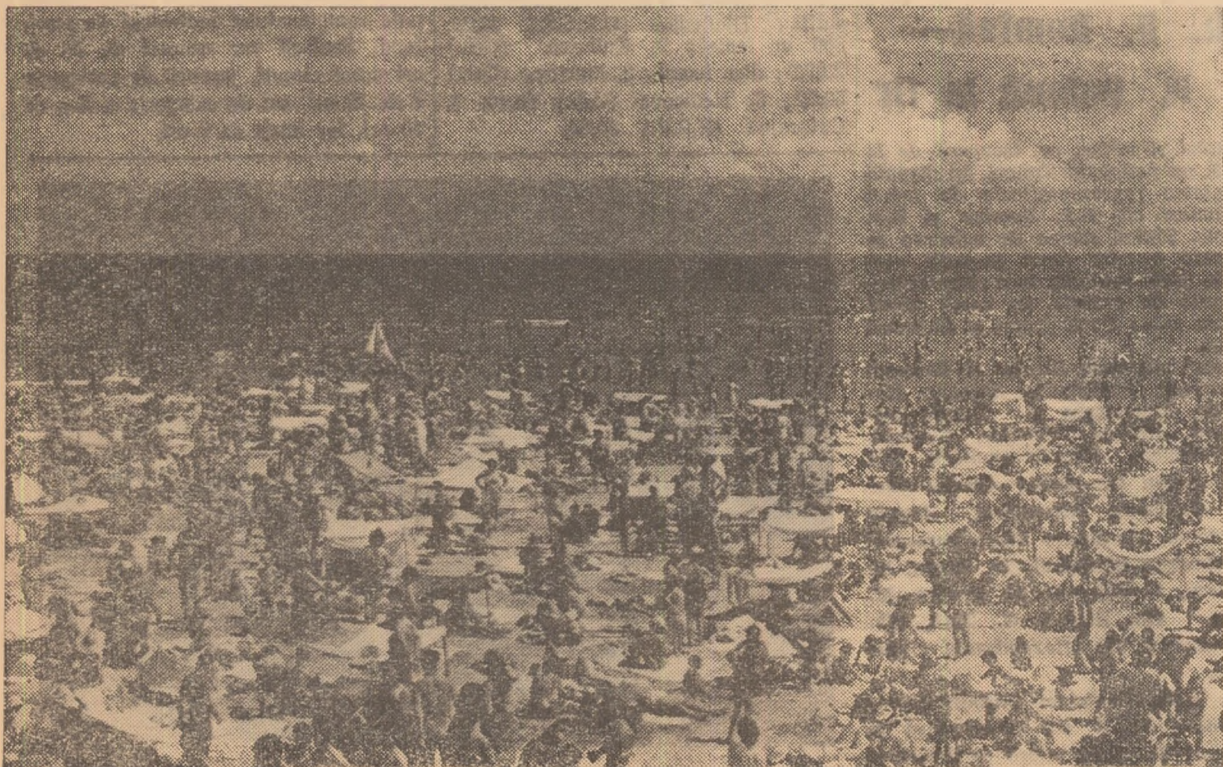
Vara a venit... totuși! E drept, cu întîrziere dar farmecul ei poate fi gustat acum din plin, mîi ales la mare.

Excursia va avea loc în două etape. Prima etapă București-Ploiești se va desfășura azi, cu plecarea de la ora 15 din fața stadionului sportiv Dinamo, iar etapa a doua: Ploiești-Slănic-București mîine dimineață cu plecarea din Ploiești la ora 6 și întoarcerea în București în jurul orei 20.