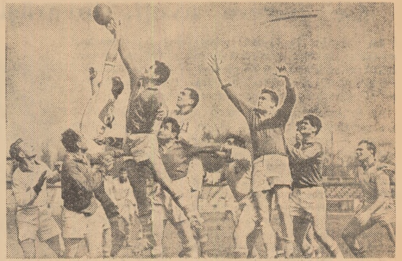
Ultima etapă a turului campionatului de rugbi „23 August” întilnește azi pe Dinamo (teren Gloria, ora 17,30), iar miine sînt programate partidele: I.T.B. — C.S.M.S. (teren I.T.B. ora 9), Rapid — Progresul (stadion Giulești, ora 17), C.C.A. — Știința Buc. (teren Ghencea, ora 18). În țară se dispută meciurile: Știința Cluj — Olimpia Brașov și Știința Petroșani — C.F.R. Grivița Roșie. În fotografie un aspect din întilnirea C.F.R. Grivița Roșie — Dinamo