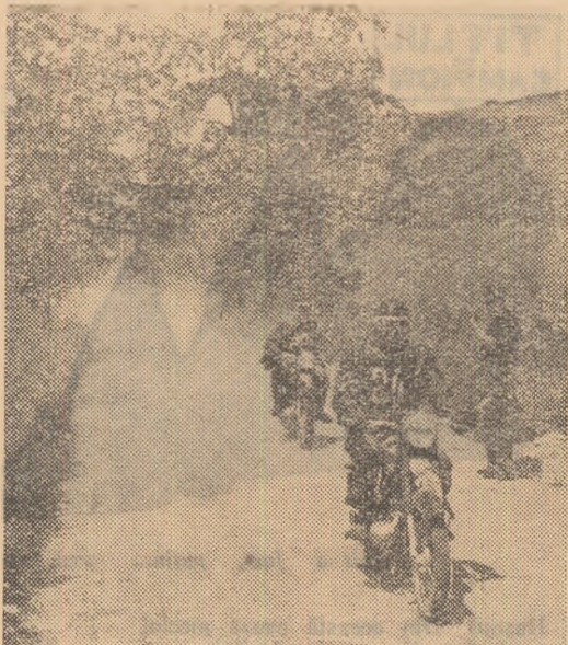
Peisajul fermecător pe care l-am întîlnit în drumul de la Tușnad la Lacul Roșu i-a ajutat pe concurenții să învingă mai ușor duritățile traseului.