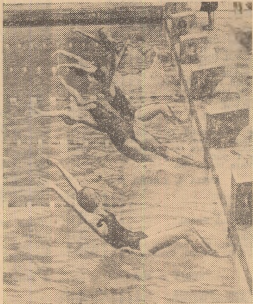
Start în proba de 100 m. spate fete