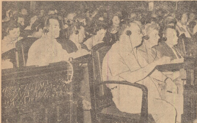
Aspect din timpul desfășurării lucrărilor consfătuirii metodice internaționale de gimnastică.