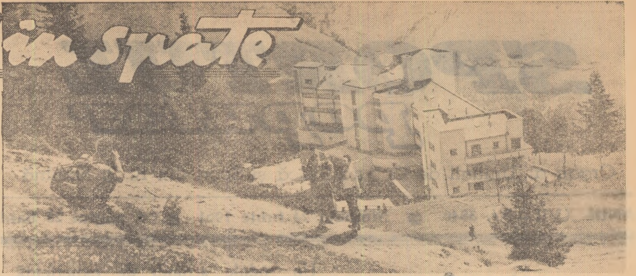
Un urcuș destul de greu dar plăcut, la cota 1400. Aparatul de fotografiat a fost scos din rucsac și... albumul familiar se va îmbogăți cu încă o poză.