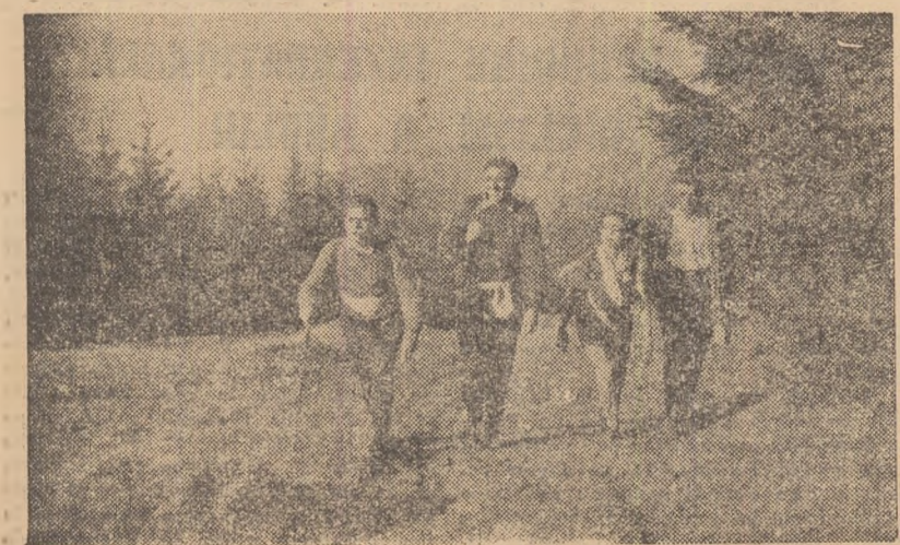
La drum spre Muntele Mic