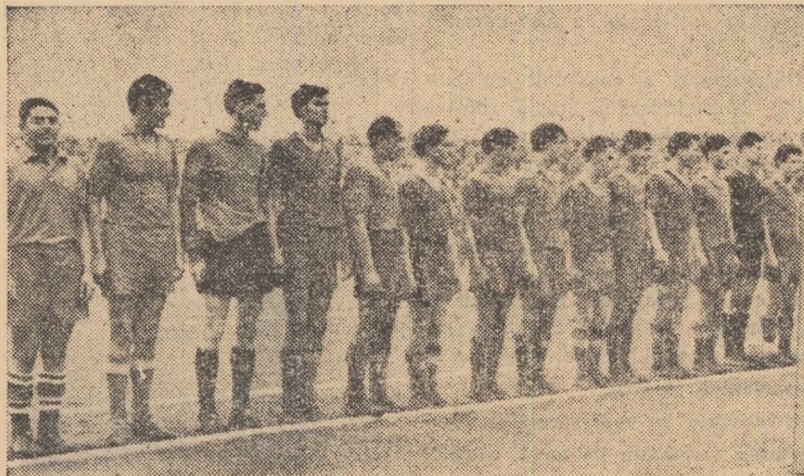
Noua campioană republicană la juniori, echipa Dinamo București

Pe scurt, finala campionatului de juniori a avut următoarea desfășurare. Oaspeții au preluat inițiativa de la început, manifestând multă dârzenie în disputarea balonului. Acți-