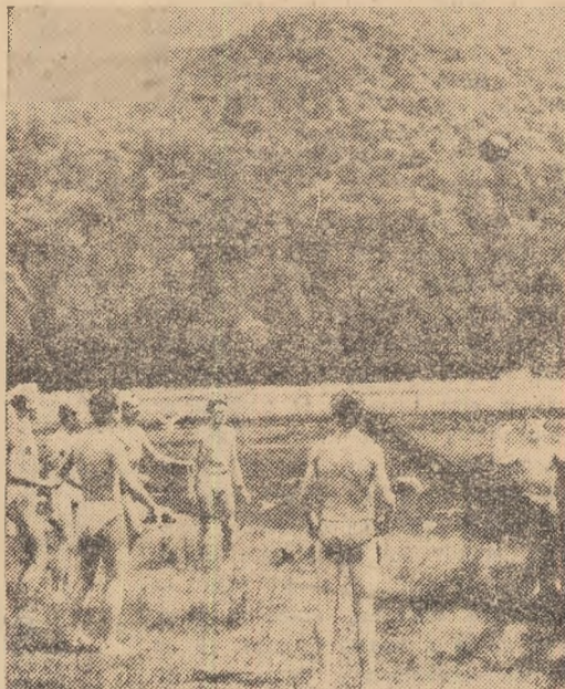
Aerul curat, liniștea și pitorescul atrag spre munte un număr tot mai mare de oameni ai muncii. În chîșeu, un grup de muncitori din Brașov jucînd volei pe malul lacului Ana din masivul Puciosul, munții Bodocului

vacanță aici în Retezat despre fenomenele glaciare ale masivului, despre animalele rare ce trăiesc în Retezat (cerbi, capra neagră etc.). În seara aceea cabana Buta a răsunat