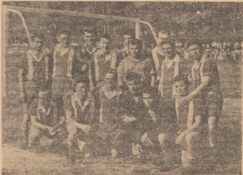
Lotul jucătorilor echipei Dunărea, avînd în mijloc pe antrenorul lor.

TR. BARBALATA (Material primit în cadrul concursului nostru „Pentru cea mai bună corespondență”)