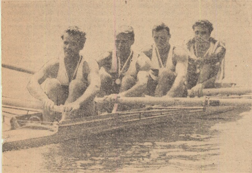
După succesul repurtat — de curind — la „Regata Praga” echipajul român de schif 4 rame a obținut ieri o nouă și valoroasă victorie în cadrul „Regatei Bled”.

concursul internațional. Sportivii omni au participat la două probe de calificări (4 rame și 4+1) obținând rezultate deosebit de bune, care le-au dat dreptul să participe în finalele disputate duminică. De rețenționat că la 4 rame sportivii romini au eliminat din concurs (simbătă, la calificări) echipajul italian, la 8+1 s-a participat direct în finală. Și, astfel, schiștii romini s-au