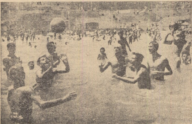
Voleibaliștii au intrat... la apă. Au făcut-o forțați de „împrejurări”, fiindcă pe plajă i-ar deranja pe cei care se odihnesc la soare. O partidă de volei și atunci cînd valurile ajung la piept.

lată, pe scurt, activitatea sportivă dusă în stațiunea Vasile Roaită: În ultimele două săptămîni la cele 11 mese de șah s-au organizat concursuri la care au participat 225 de oameni ai muncii. La cele 8 mese de tenis s-au întrecut 252 de concurenți. A fost organizat un original concurs de subah, la care au participat 18 reprezentanți de vile. La cele două concursuri de înot au luat startul 112 tineri și virșnici, iar pe terenul de tenis de cîmp s-au întrecut 14 tineri. Nici handbalul redus nu a fost uitat: a fost organizată o întrecere între două echipe feminine și două masculine compuse din cei veniți la odihnă. Pe lângă toate acestea notăm și pe cei 50 de amatori care învață zilnic, cu sîrguința unor școlari abecedarul înotului. Cele două excursii făcute cu vasul „Neptun” în largul mării au antrenat 276 de persoane.