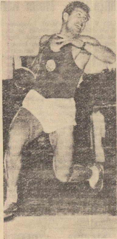
Campionul balcanic Todor Arturski

Meciul echipelor masculine de la sfârșitul săptămânii viitoare se anunță extrem de echilibrat. Atleții bulgari, în accentuat progres în ultima perioadă de timp, au realizat în acest an o serie de rezultate remarcabile. Fofosim acest prilej pentru a prezenta cititorilor noștri câteva din cele mai bune performanțe din 1961 ale viitoarelor gazde ale atleților noștri: 100 m: Biciarov 10,5, Velov 10,7; 200 m: Biciarov 21,6, Volov 21,9; 400 m: Dimitrov 49,3, Antonov 49,5; 800 m: Sapungiev 1:51,9, Spasov 1:52,6; 1.500 m: Stoianov 3:50,6; 5.000 m: Peev 14:36,4, Vucikov 14:57,4; 110 mg: Zlatarski și Vladkov 15,1; 400 mg: Cengher 54,8, Dimitrov 55,1; 3.000 m obst: Peev 9:07,6; lungime: Tonev 7,46, Slavkov 7,18; triplu: Patarinski 15,70, Gurgușinov 15,40; înălțime: Kumarnov și Grigorov 1,99; prăjină: Hristov 4,47, Hlebarov 4,40; greutate: