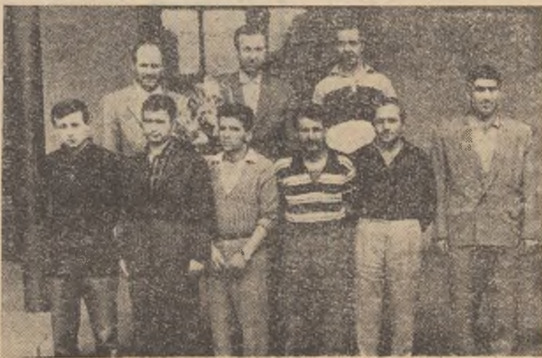
Cinci minute după sosirea boxerilor turci