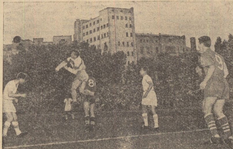
Ghiță, portarul echipei St. roșu, intervine la o centrare. El reușește să respingă cu pumnul mingea urmărită de Ene II (nr. 8).