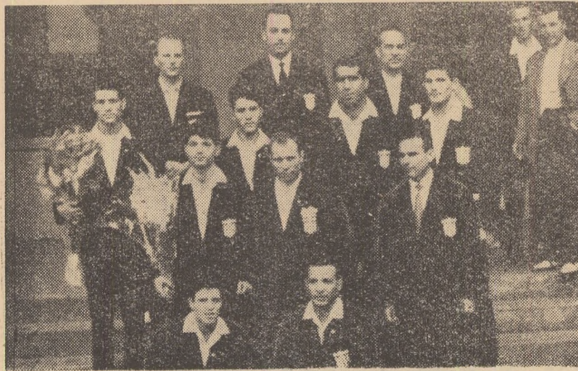
La sosirea în Gara de Nord boxerii greci au ținut să pozeze în fața obiectivului fotografic