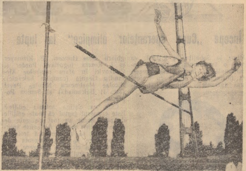
Saritura record a Iolandei Balas înregistrată de fotoreporterul agenției B.T.A.

În concluzie, se impune perfecționarea metodei de antrenament pentru că numai astfel, prin îmbunătățirea continuă a metodei de instruire, putem realiza o mai rapidă ridicare calitativă a fotbalului nostru.