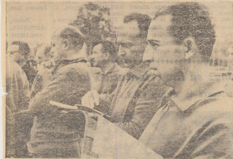
Un moment din timpul cursului internațional pentru antrenori de la Macolin.

Se aduce la cunoștința candidaților care s-au înscris, prin consiliile regionale U.C.F.S. la examenul pentru obținerea calificării de antrenor, că data începerii sesiunii de examen este 23 iulie 1961, orele 8 dimineața la Institutul de Cultură Fizică din str. Maior Ene nr. 12.