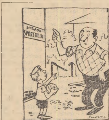
— Tot administrator, nu vi se pare că terenul ăsta n-are nici o conținută cu sportul? — Cum să n-sibă, măi sică, nu vezi că e pe... strada Sportului? Desen de S. Novac