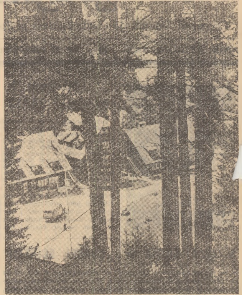
Incântător este peisajul Timișului de Sus. Pe pantele repezi din jur, printre brazi seculari, în apropierea panglicii argintii a soarelui și a învolburatelor ape ale Timișului, descoperi aproape la tot pasul cabane confortabile și elegante. Așu cum sînt și cele din imaginea noastră, unde sute de pionieri și utemiști își petrec zilele plăcute de vacanță

Au un singur pas elevii școlilor sportive veniți în tabără la Eforie: sfatul popular al orașului Vasile Roaită nu s-a îngrijit să pregătească pentru cei peste 500 de copii care-și petrec rînd pe rînd vacanța aici terenul din spațiile cabanelor, unde se desfășoară o bună parte a activității lor zilnice. Pentru ei era necesar un teren corespunzător unde să se antreneze, să susțină meciuri. Terenurile de volei sînt inutilizabile. Porțile de handbal în șapte n-au plase, iar uneia, și mai rău, îi lipsește bara transversală. Cînd se marchează un gol, se iscă dis-