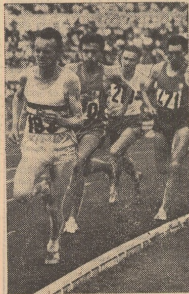
Aspect din finala olimpică — 1960 a cursei de 1.500 m. Se văd în fotografie: Rozsavölgyi, Jazy, Vamoș, Bernard

Forul athletic din FRANȚA a comunicat înscrierea, de principiu, a 5 din cei mai valoroși sportivi la ora de față. Este vorba de Michel Jazy (campion internațional pe 1.500 m în 1960) câștigătorul medaliei de argint la J.O. de la Roma puternicul său rival Michel Bernard (finalist olimpic la aceeași probă dar și un remarcabil alergător pe 5.000 m—13:56,0 în acest an), Robert Bogey, succesorul celebrului Alain Mimoun la recordurile Franței pe 5.000 m (13:53,6 în 1961) și 10.000 m (29:01,6 în 1960), sprinterul Jocelyn Delecour creditat în acest sezon cu 10,3 sec. pe 100 m și 20,8 sec. pe 200 m, și sulițașul Michel Maquet (binecunoscut publicului nostru) al doilea performer mondial al anului cu 83,36 m.