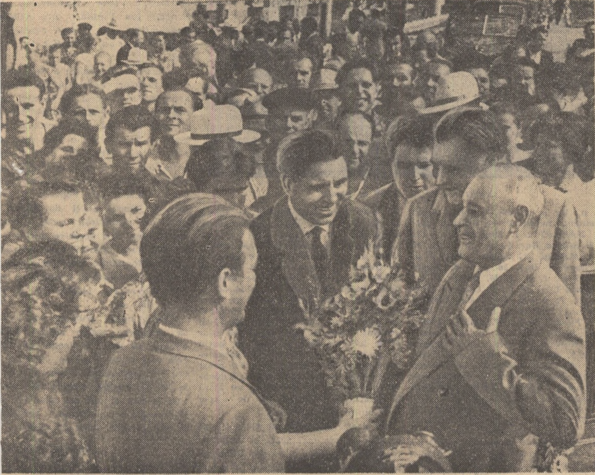
Călduroasa primire făcută la Kiev delegației de partid și guvernamentale a R. P. Române

Pe aeroportul Borispol, pavoazat sărbătorește, oaspeții au fost întâmpinați de Nikolai Podgornii, membru al Prezidiului C.C. al P.C.U.S., prim-secretar al C.C. al P.C. din Ucraina, Demian Korotcenko, membru supleant al Prezidiului C.C. al P.C.U.S., președintele Prezidiului Sovietului Suprem R.S.S. Ucrainene, Vladimir Scerbițki, președintele Consiliului de Miniștri R.S.S. Ucrainene, și de alți conducători ai republicii, de reprezentanți ai mass-mediei publice din capitala Ucrainei.