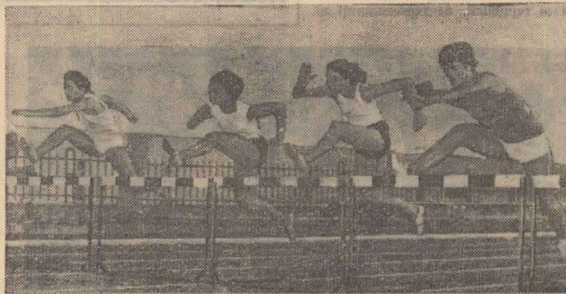
Aspect din cursa de 80 m garduri

La Reșița se simte de vreun an un suflu nou în privința atletismului. În acest puternic centru muncitoresc se lucrează cu multă tragere de inimă. Au fost crescuți numeroși tineri talentați și... rezultatele se văd!