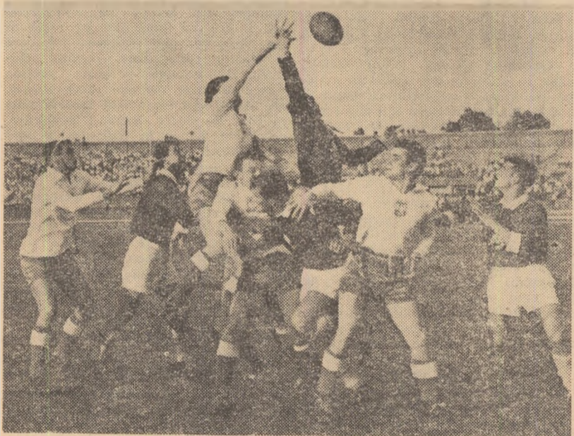
Una din numeroasele faze spectaculoase din meciul de rugbi R. P. Română (tineret)—R. P. Polonă (tineret).