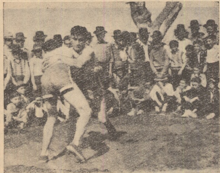
In joc și voie bună tinerii muncitori ploieșteni se pregătesc pentru Concursul cultural-sportiv. Pe scenă și pe stadion ei dovedesc aceeași măiestrie ca și în producție.