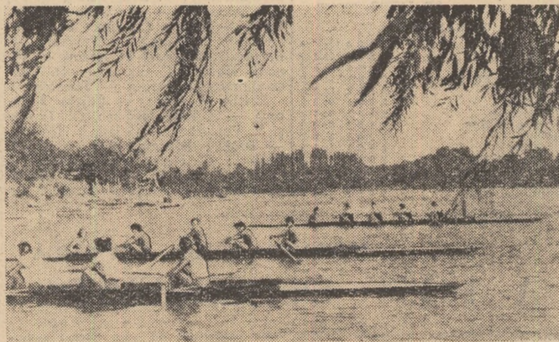
Un aspect din „Cupa Rapid”: start la 4-1 rame fete.