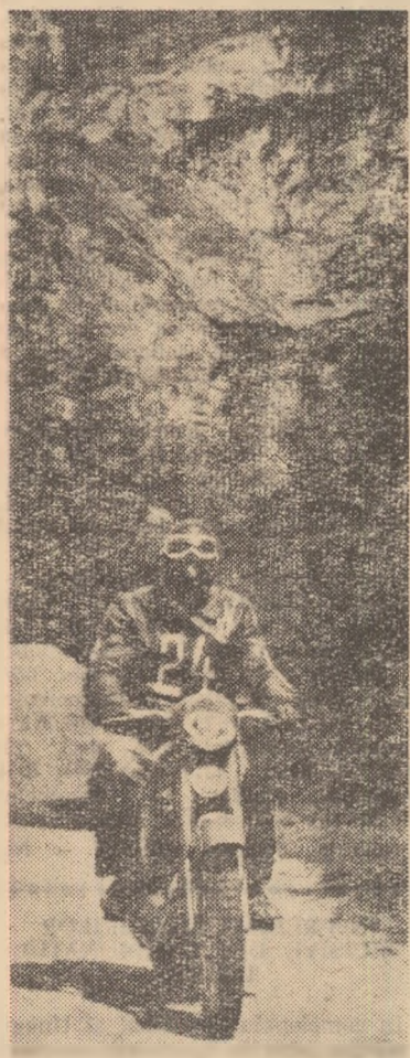
Cursa de 6 zile (campionatul republican de regularitate și rezistență) va trece și prin stațiunea Lacul Roșu. Iată un aspect dintr-o întrecere desfășurată anul acesta pe aceeași rută.