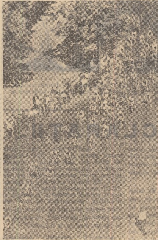
Aspect din desfășurarea primei etape, pe circuit, a „Turului ciclist al R.P. Romine” ediția a IX-a.

Firește, nu se poate ști înainte de încheierea întrecerii. Cu fiecare an organizarea competiției este tot mai bună, iar sarcina comisiei de alcătuire a clasamentului tot mai... dificilă.