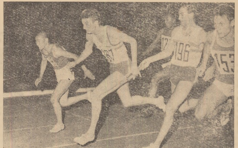
Un schimb la ștafeta de 4x100 m bărbați.