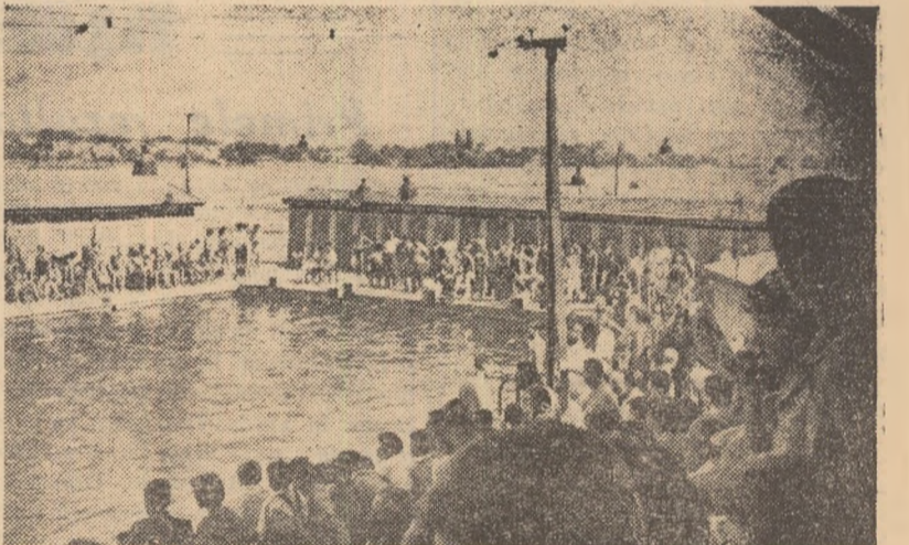
Această imagine surprinsă pe pelicula fotografică dovedește sugestiv interesul manifestat de lugojenți față de actuala ediție a campionatelor de natație