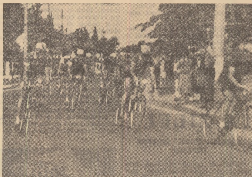
Cei 15 „fugari” gonesc spre București, Fază din desfășurarea etapei a II-a a „Cursei Victoriei”.

„Cursa Victoriei” se înscrie ca una dintre competițiile cicliste tradiționale din țara noastră. Eforturile făcute de Casa Centrală a Armatei pentru o mai bună organizare a acestei tradiționale competiții au fost încununete de succes.