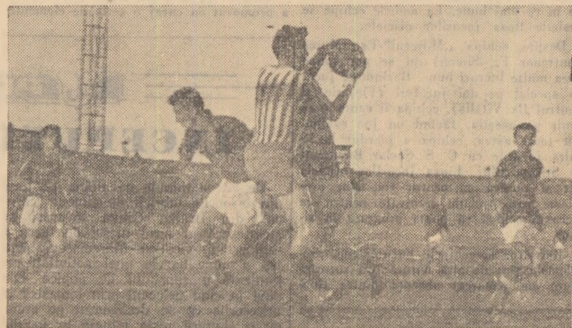
Fază din meciul Dinamo Obor — C.F.R. Roșiori 2-1 (0-1)

ȘTIINȚA BUCUREȘTI — C.S.M. MEDIAS 2-1 (2-0). — Desi viu disputat jocul a fost de un nivel tehnic mediocru. Ambele echipe au avut perioade de dominare dar ineficacitatea liniilor de atac a fost vizibilă. Față de desfășurarea partidei un rezultat de egalitate ar fi ogindit mai just raportul de forte de pe teren. Au înscris Spătaru și Zănescu pentru studenți, Oancea pentru medieseni. (N. Tokacek — coresp.).