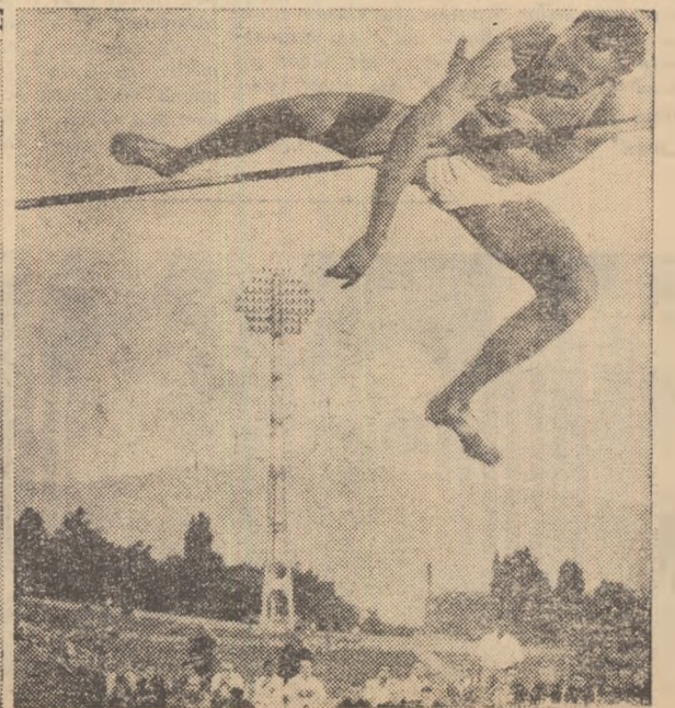
Iată-l pe Valeri Brumel, care la Sofia a stabilit un nou record mondial (2,25 m) în plin efort deasupra ștachetei.