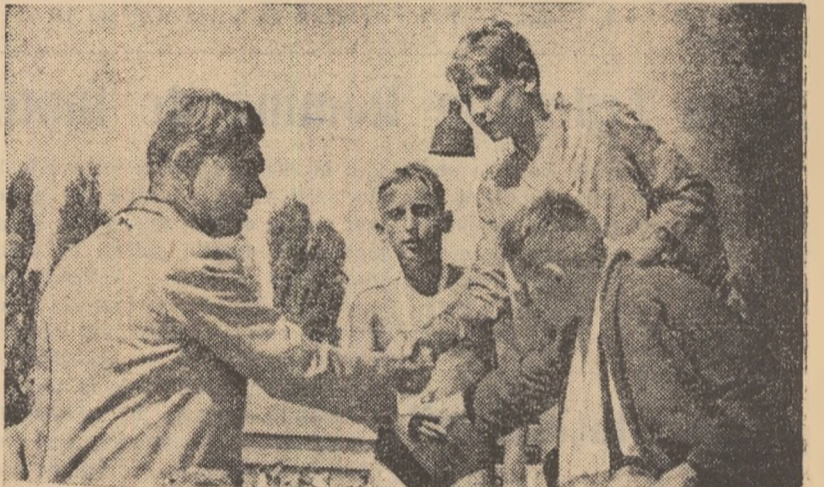
Moment festiv la finale: primilor clasași în proba de 50 m liber copii cat. a) II-a le sint înminate tricouri, medali, diplome