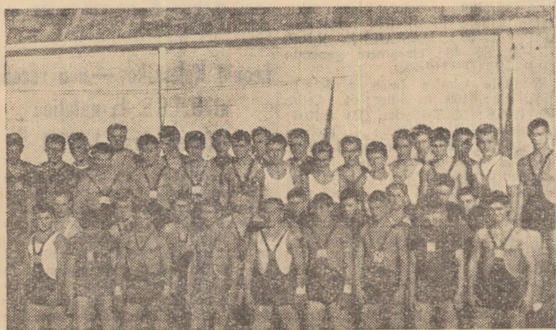
Finaliștii campionatelor republicane de juniori înaintea startului