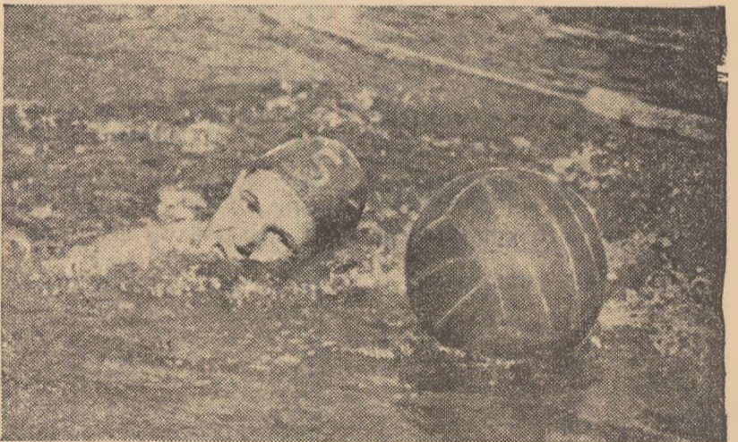
Obstacol în calea micului inotător? Nicidecum! Concurentul pe care îl vedeți în fotografie, elevul Iosif Adoc din Arad, este totodată și căpitanul echipei de polo de pitești din orașul său natal