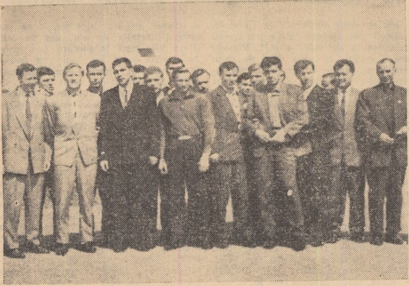
Fotbaliștii de la Lokomotiv Moscova, imediat după sosirea la aeroport