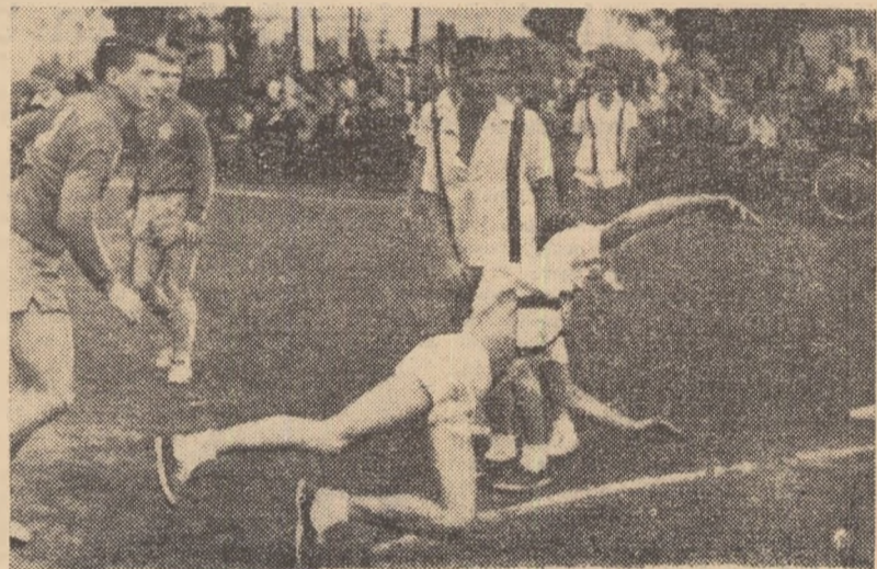
Ciolan (Știința) a depășit întreaga apărare a C.C.A., înscrinînd spectaculos. Fază din jocul C.C.A. — Știința Galați

Petrolul Teleajen — Știința București 17-16 (7-6); Tractorul Brașov — Dinamo București 15-28 (6-15).