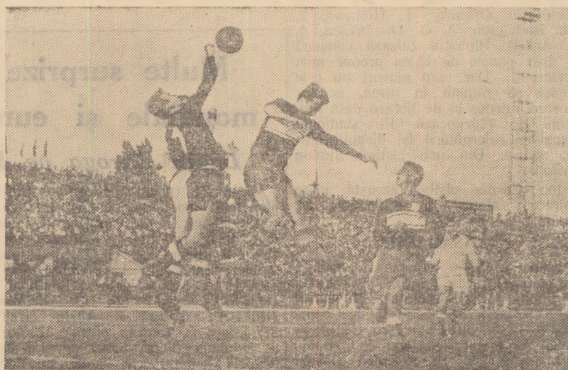
Andrei, talentatul portar al metalurgiștilor, respinge un nou atac rapidist.