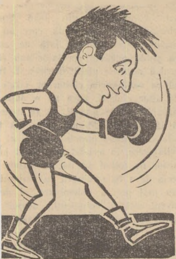
PĂTRAȘCU (R. P. Romîna)

Întilnirea de astă-seară, de pe stadionul Republicii, constituie o verificare cit se poate de utilă și pentru echipa de tineret a țării noastre.