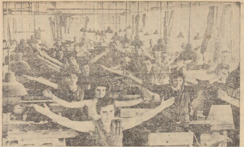
Gimnastica în producție se bucură de mult succes în rîndul muncitorilor de la întreprinderea „Carmen” din Capitală. În prezent, cu prilejul alegerii organelor locale ale U.C.F.S. a fost discutată îmbunătățirea și îmbogățirea exercițiilor de gimnastică în producție.