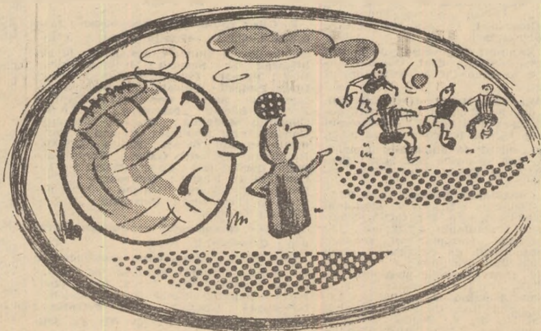
Popicul: — Ce curios! De atîta timp ei n-au descoperit că mai există și alte sporturi! Poate ne-ar mai lăsa și pe noi să ne odihnim!