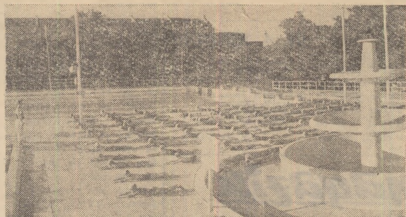
Școlari și școlărițe din Tientsin își încep lecția de inot făcînd exerciții la gimnastică.