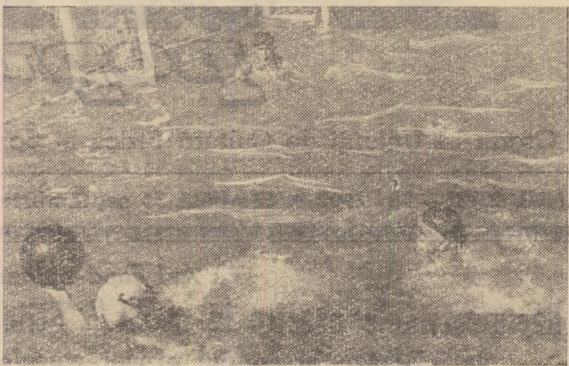
Fază din întâlnirea Progresul București — Mureșul Tg. Mureș, desfășurată joi în Capitală.