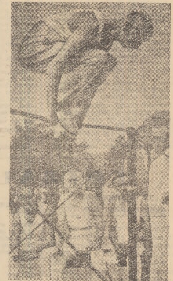
Bunicii gimnasticii în întrecere. La Freiburg (R.D.G.) a avut loc un concurs de gimnastică cu participarea celor mai virtușici. La bară fixă unul dintre competitori, care a debutat în acest sport în urmă cu șase decenii...