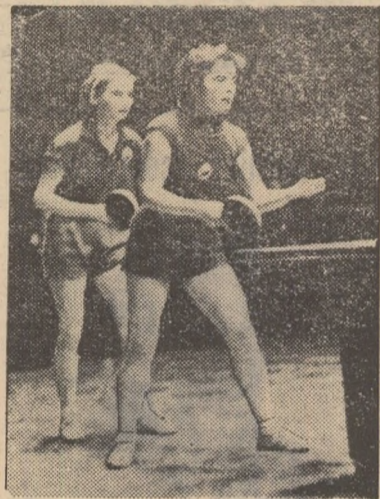
În cele trei zile ale întrecerilor de tenis de masă din Capitală spectatori vor avea prilejul să vadă la „lucru” și pe campioanele mondiale Maria Alexandru și Geta Pitică.