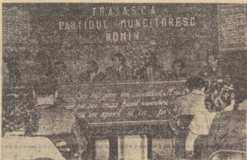
Participanții la conferință, luînd cuvîntul, au analizat cu spirit de răspundere defectiunile din munca vechiului consiliu al asociației și au făcut propuneri judicioase pentru viitor.

Avind asigurată prin funcționarea grupelor sportive o solidă bază organizatorică, consiliul asociației a reușit să angreneze astfel mult mai ușor iubitorii de sport într-o activitate continuă. Numeroasele competiții organizate în cinstea unor zile festive, întrecerile din cadrul marilor competiții de masă. Concursul cultural-sportiv al tineretului, crosurile 1 Mai și 7 Noiembrie, trecerea normelor G.M.A. și mai ales cam-