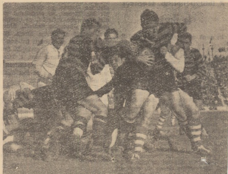
Grămadă deschisă inițiată de oaspeți. Înaintarea Griviței Roșii va destrăma în această acțiune.