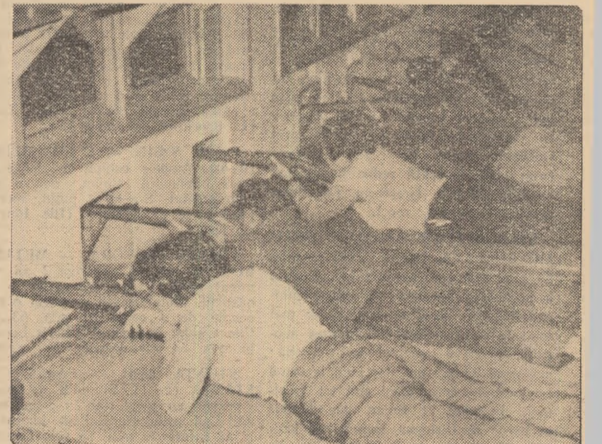
Aspect din timpul întrecerii