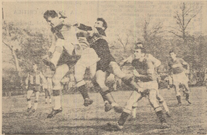
Fază din meciul Știința București — Farul (2-1). Atac la poarta echipei Știința.

o victorie meritată, prin golurile înscrise de Coteș (min. 55) și Militaru (min. 65). Dacă în prima repriză oaspeții au anihilat atacul localnicilor, la reluare, fotbalistii brăileni și-au impus superioritatea și au reușit să fructifice ocaziile avute. (I. Baltag — coresp.).