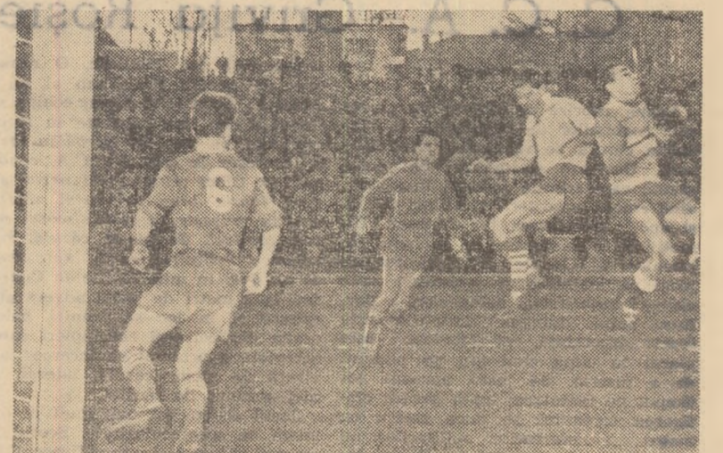
În special în repriza a II-a Curcan a avut multe intervenții salvatoare. Iată-l în fotografie prinzînd cu siguranță balonul, deși este jenet de Tîrgovnicu.