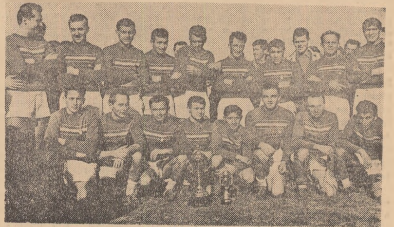
Echipa C.C.A., campioană republicană pe anul 1961, la câteva minute după jocul cu Știința București

Mii de bucureșteni au venit ieri, pe un timp splendid, la stadionul Tinerețului, să „prindă” și acest ultim act al