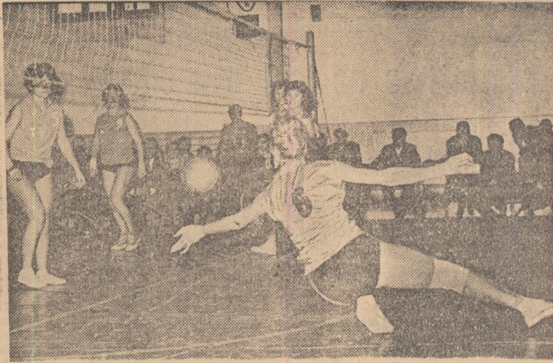
Fază din meciul Combinatul Poligrafic—Farul Constanța (1-3)