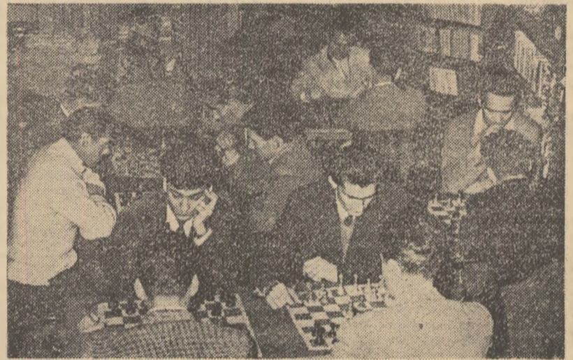
Primele întreceri... Într-una din sălile bibliotecii Ministerului Agriculturii, membri ai asociației sportive Recolta M.A. au început ieri — după o frumoasă festivitate de deschidere — competiția de șah din cadrul Spartachiadei de iarnă a tineretului. În același timp, într-o sală alăturată, se întreceră jucătorii de tenis de masă. Iată-i pe șahiști la mesele de concurs.