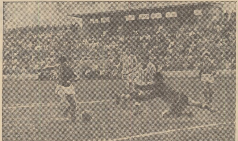
In meciul cu Mureșul Tg. Mureș, echipa G.S.O. Crișana a avut una din cele mai bune comportări din sezonul fotografie, o fază din această intilnire: — inscrie al doilea gol.

(2,27) și numărul de goluri marcate (aproape două de meci) dovedește efi-cacitatea inaintării și jocul bun al apărării. Un fapt pozitiv la CSO Crișana, întinerirea echipei. Deși in ultimul timp mai mulți jucători de bază au plecat, lipsa lor nu s-a resimțit. Au fost inlocuiți imediat cu juniori și rezultatul se vede. Din lotul de 19 ju-cători, 7 sint tineri, pină la 19 ani, majoritatea elevi cu note bune la in-