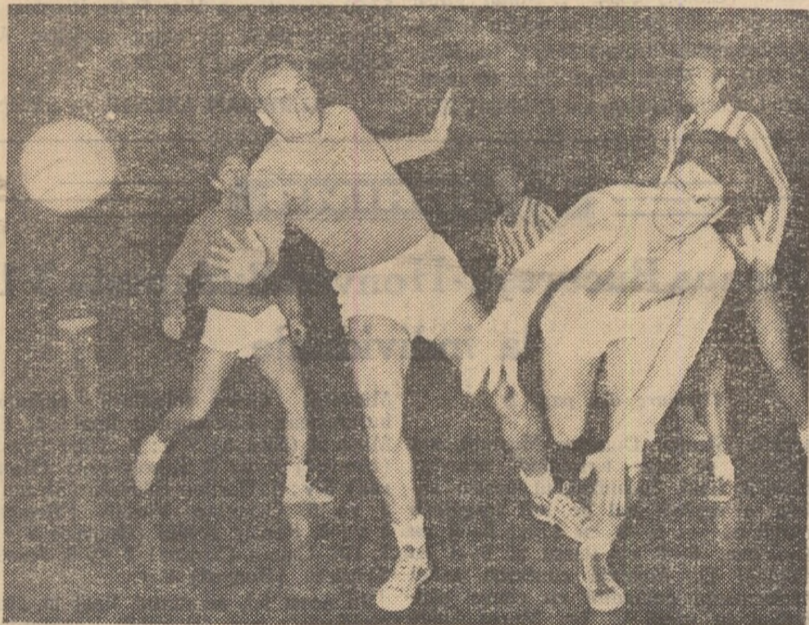
Fază din meciul Flacăra roșie—Metalul „23 August“ câștigat de prima echipă

Ediția din anul acesta a „Cupei de iarnă“ rezervată echipelor de handbal în 7 din Capitală a debutat cu... un succes de public neașteptat. Ieri, la foarte puțin timp după începutul primului joc, mulți amatori care făcuseră deplasarea la sala Dinamo (în ciuda abundenței ninsori) au fost nevoiți să facă cale întoarsă din pricina negăsirii mult doritului bileț.