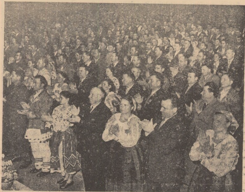
Aspect din sală de la încheierea lucrărilor Consfătuirii pe țară a țăranilor colectivști