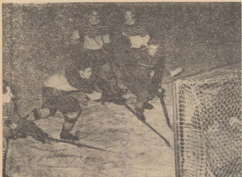
O fază din meciul dintre echipele bucureștene de juniori I.T.B. și Steaua. Atac la poarta echipei Steaua.