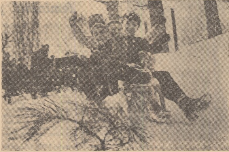
Atenție! Pirtie liberă!... Echipajul de 4 din fotografie se avintă — pentru a câta oră? — pe dealurile înzăpezite din jurul Herăstrăului. Imagini asemănătoare vom întâlni foarte des, pretutindeni în țară, în zilele vacanței de iarnă.

Tabere și excursii organizează și alte școli din Capitală. Astfel, un număr de