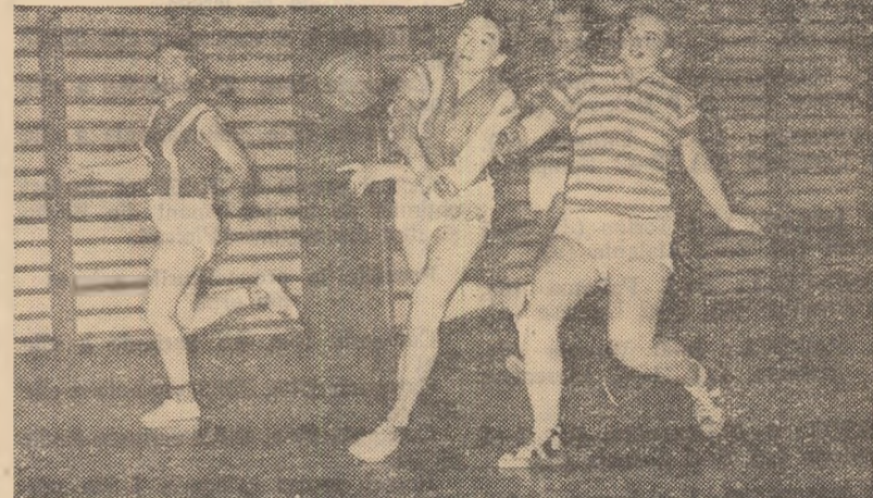
O fază din meciul echipelor feminine Rapid-I.T.B.

„Cupa de iarnă”, competiție care a stîrnit un mare interes în rîndurile amatorilor de handbal din Capitală, programează astăzi după-amiază și miine dimineață în sala Dinamo o nouă serie de partide, dintre care multe promit spectacole atractive, dinamice. În această direcție vom sublinia, în primul rînd, că în programul acestei etape a „Cupei de iarnă” figurează partida dintre echipele masculine Dinamo și Știința, un adevărat derbi al competiției. Ambele formații au manifestat la primele jocuri o formă bună, anunțîndu-se drept principalele pretendente la primul loc. Este deci firesc ca înfrîngerea lor să fie așteptată cu mult interes.