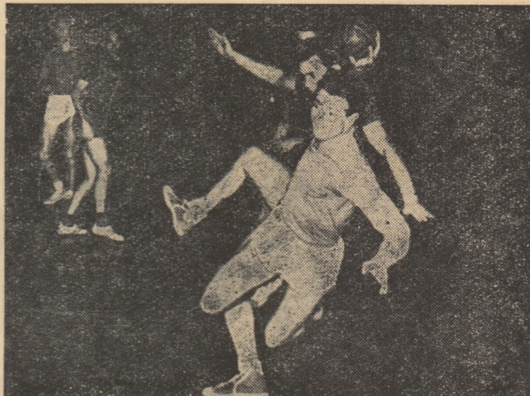
Costache II l-a depășit pe Marcu și va arunca la poartă din plonjon. Fază din meciul Dinamo—Steaua