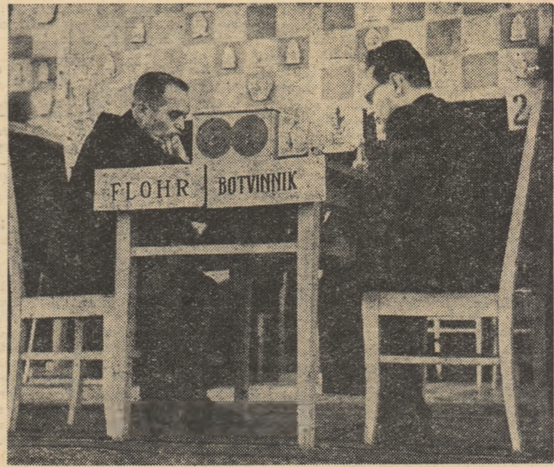
Din nou s-au întîlnit în fața tablei de șah cei doi vechi prieteni și... adversari, în concursuri, marii maeștri sovietici Botvinnik și Flohr. În ultima rundă a turneului de la Hastings ei au făcut remiză, Botvinnik rămînd cîștigător distanțat al întrecerii

Anul ce a trecut a fost marcat în U.R.S.S. de succese strălucite în domeniul ridicării nivelului tehnic al performanțelor. Sportivii sovietici au stabilit 62 de noi recorduri mondiale și 190 de recorduri unionale.