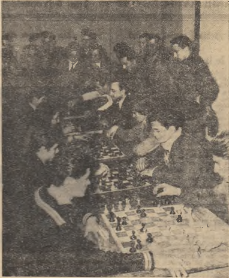
Întrecerile de șah se desfășoară în mijlocul unui deosebit interes. Imaginea noastră este edificatoare