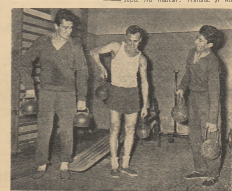
Dinamo Obor, din seria a II-a a categoriei B, și-a început de două săptămîni antrenamentele, care - în prezent - urmăresc pregătirea fizică generală. Cele două antrenamente săptămînale în sală au drept scop dezvoltarea forței și rezistenței. În fotografie: un aspect de la antrenamentul de ieri. Jucătorii fac exerciții de forță, cu greutate.