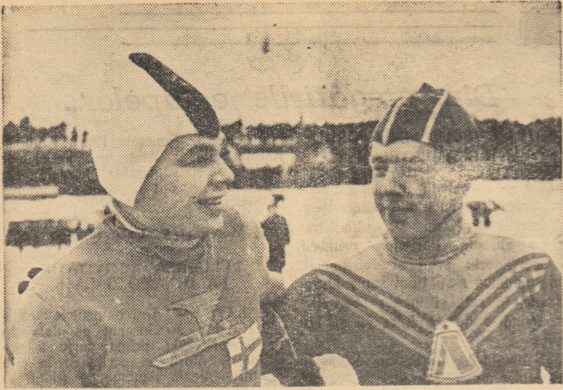
Tradiționalul concurs al patinatorilor din Helsinki și Leningrad, desfășurat zilele trecute pe stadionul Dinamo din Leningrad, s-a încheiat, ca și primele șase ediții ale acestei întreceri, cu victoria patinatorilor sovietici.