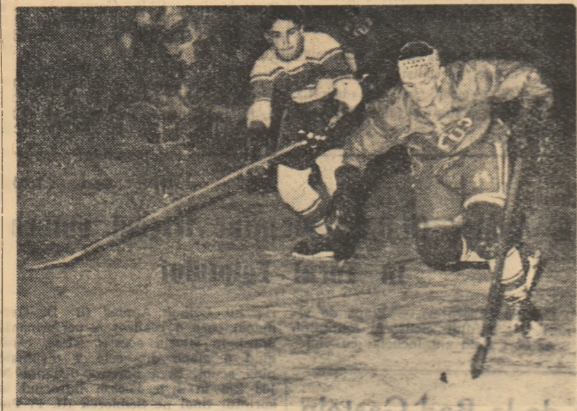
Fază din meciul Știința Cluj — Steagul roșu Brașov (10-0). Atacantul clujean Ötvös conduce puțul, urmărit de apărătorul advers

În sfîrșit, în vederea lărgirii cadrelor de arbitri în orașul București, colegiul orașenesc va organiza de la 27 ianuarie un curs de arbitri. Cei care doresc să urmeze aceste cursuri se vor adresa, pentru relații, la noul sediu al U.C.F.S. oraș București din str. N. Filipescu nr. 21—23 (etaj) azi, între orele 18—20.