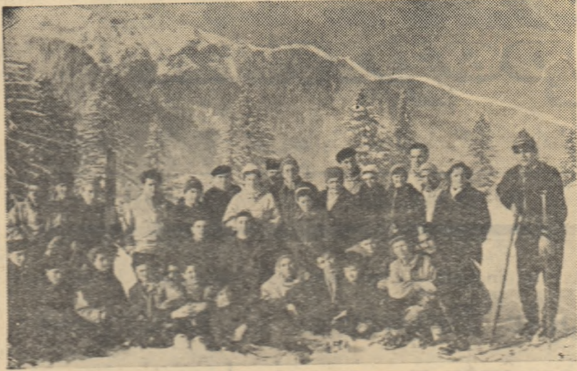
Un grup de excursioniști din Iași la cabana Dihan din Bucegi.

De fiecare dată când grupuri de turiști pleacă la excursie ori la odihnă, tovarășul Oreste Cotargiu, șeful agenției O.N.T. "Carpați" Iași le spune: „Drum bun, tovarăși și petrecere plăcută!”