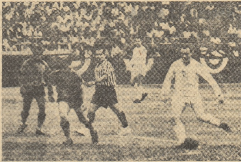
Echipa de fotbal Banik Ostrava întreprinde în prezent un turneu în Republica Cuba. În primul meci, susținut la Havana, fotbalistii cehoslovaci au întrecut cu scorul de 5-1 formația locală Lawton.

În fotografie: un aspect din timpul acestui meci.