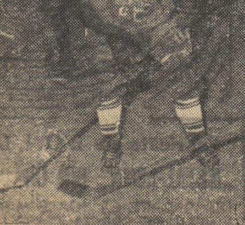
Fază din meciul Steaua—Știința Cluj.