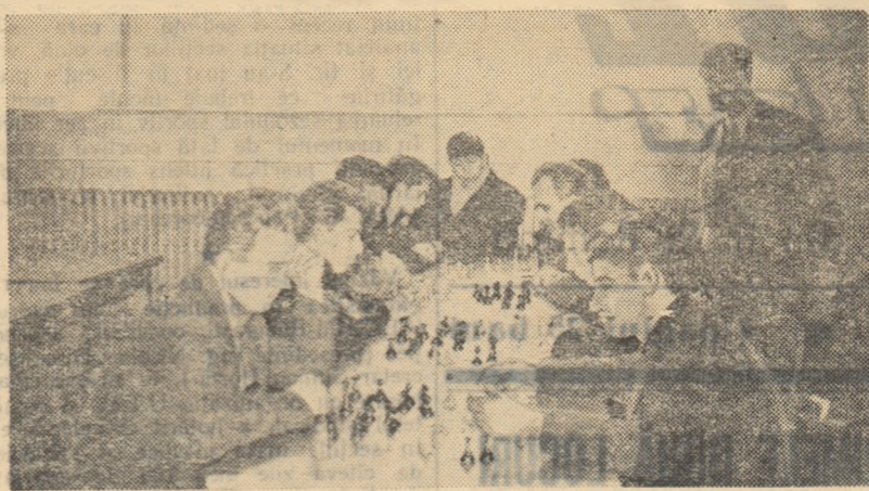
În fiecare duminică, nenumărați iubitori ai sportului din asociațiile ploieștene „Iau cu asalt” sălile și bazele sportive, puse la dispoziție de către clubul orașenesc Petrolul. Au loc însușite întreceri de șah, schi sau tenis de masă în cadrul Spartachiadei de iarnă a tineretului.

Din orasul Satu Mare, menționăm deosebite se cuvin asociațiilor sportive școlare Lucașfăruș și Olimpia,