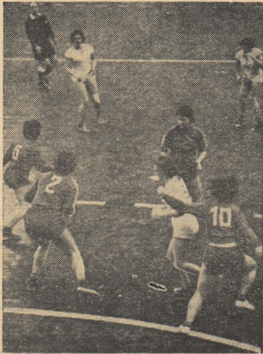
Fază din meciul susținut de echipa noastră de juniore cu selecționata Slavoniei (jucătoarele noastre în tricouri de culoare închisă).