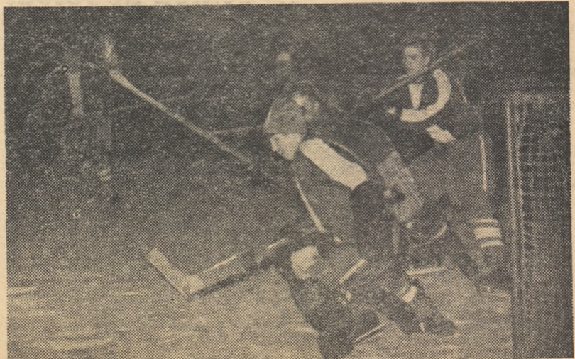
Iată o fază spectaculoasă la poarta echipei L.I.I.J.T. Leningrad în meciul cu prima formație a orașului București.

În ceea ce privește semifinalele s-a stabilit ca acestea să aibă loc la 27 aprilie (finala la 29 aprilie) pentru că în ziua de 25 aprilie să se poată disputa o întîlnire preliminară. Fiind cinci echipe câștigătoare de grupe, două din ele — stabilite prin tragere la sorți — vor trebui să susțină un joc de calificare, iar echipa învingătoare va intra în semifinalele propriu-zise.