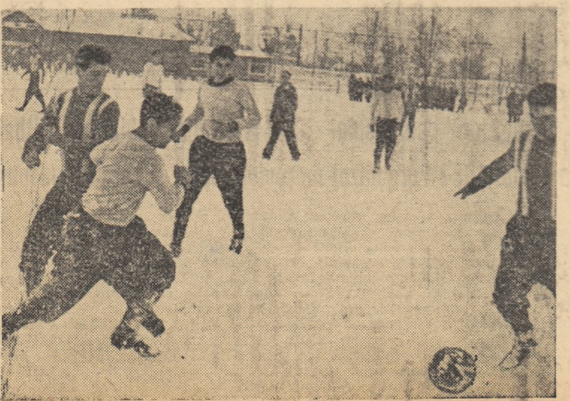
Zăpada căzută din abundență în ultimele zile nu este o stavilă în calea pregătirilor echipelor de fotbal. Dimpotrivă, ea îi ajută pe jucători să-și dezvolte calitățile fizice. Imaginea a fost luată la meciul de ieri Progresul—Flacăra roșie 6—1 (3—0).

Paralel cu aceste preocupări legate direct de desfășurarea partidelor, comisia de organizare ia de pe acum măsuri pentru asigurarea primirii delegațiilor străine, precum și pentru întocmirea unui program cit mai variat în tot timpul șederii oaspeților la Brașov. Nu lipsese din acest program, întocmit pentru orele libere ale sportivilor, vizitele și excursiile menite să le dea posibilitatea cunoașterii frumuseților orașului și ale împrejurimilor sale.