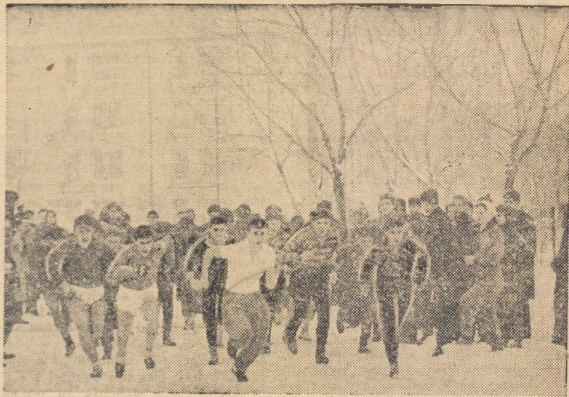
Cîteva zeci de atleți din București și Ploiești au luat parte la primul concurs de cros din acest an organizat de clubul Dinamo. Intrecerile desfășurate, pe o zăpadă mare, în împrejurimile sălii Floreasca, au fost edificatoare asupra gradului de antrenament atins de alergătorii noștri. În fotografie: start în cursa juniorilor de coteș, a II-a.