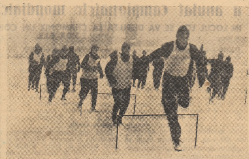
Fotbalistii de la Jiul Petroșeni își continuă pregătirile, în vederea returului, în aer liber, indiferent de starea timpului. Ei pot fi văzuți pe stadionul din Petroșeni făcînd antrenamente fie de condiție fizică, fie de tehnică individuală. În pregătirile lor, ei folosesc diferite mijloace, printre care exercițiile la aparatele ajutătoare.

În fotografie: jucătorii Jiului fac exerciții de alergare peste obstacole (porți mici).