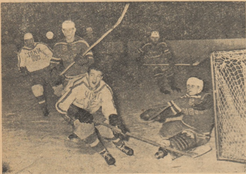
Fază la poarta echipei Einheit