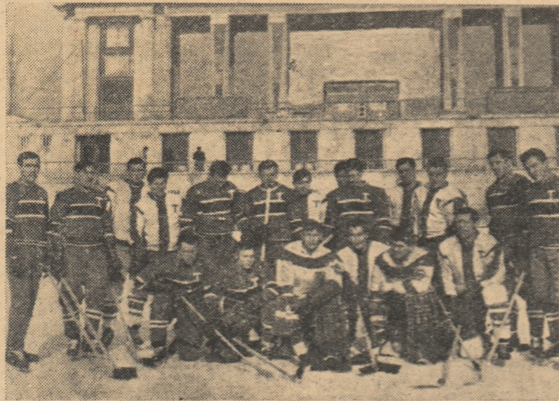
Jucătorii echipei sovietice Torpedo Gorki înainte de antrenamentul de ieri, pe patinoarul „23 August”. Împărțiți în două echipe, ei au susținut un joc la două porți.

Tinerii hocheiști bucureșteni, care înlocuiesc pe cei care au realizat bune momente de joc în partida lor de marți seacum Einheit, se vor strădui să dea replică cât mai bună oaspeților. După o absență destul de lungă din